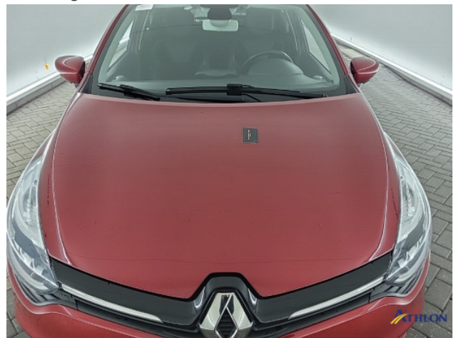
2. lakonthechting Beschadigd