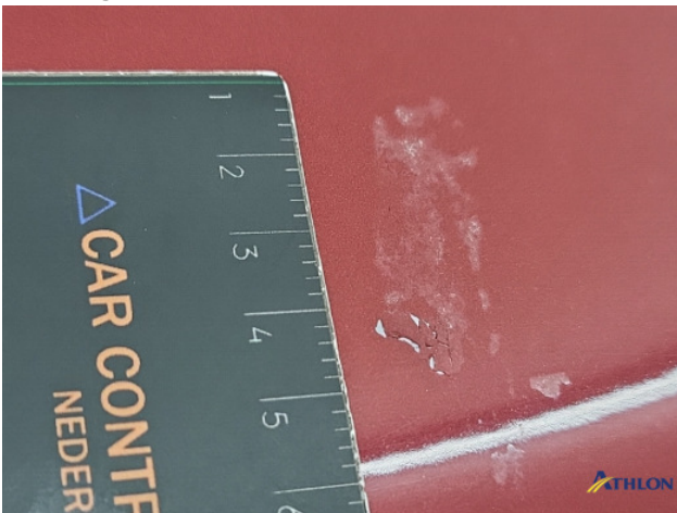
2. lakonthechting Beschadigd