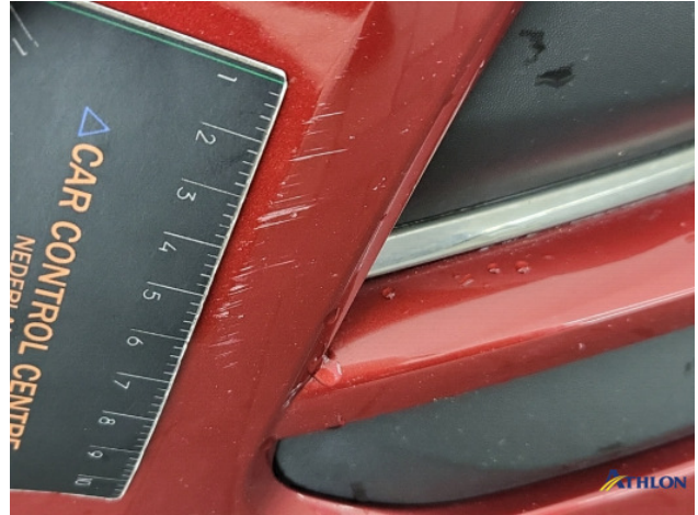
3. diverse Gebruikssporen