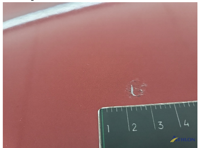
2. lakonthechting Beschadigd