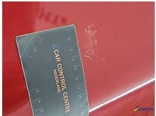
2. lakonthechting Beschadigd