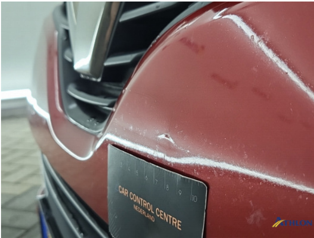
1. Voorbumper Breuk / barst / scheur