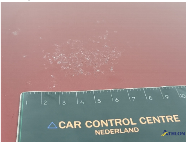
2. lakonthechting Beschadigd