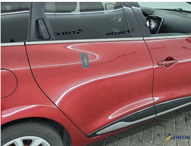
2. lakonthechting Beschadigd