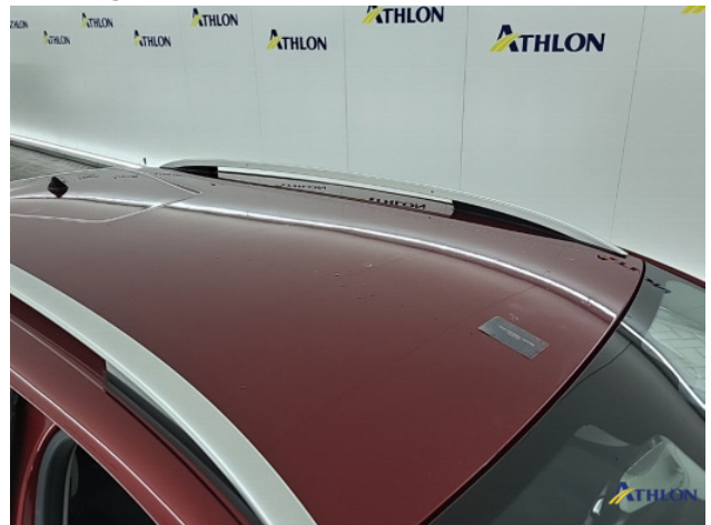
2. lakonthechting Beschadigd