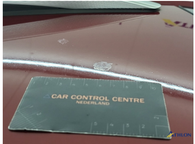
2. lakonthechting Beschadigd