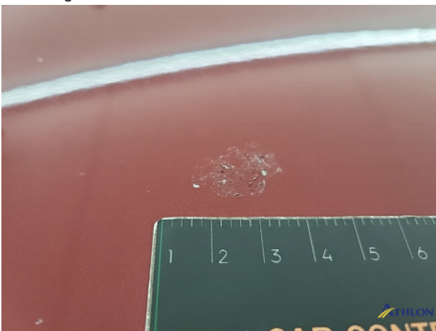
2. lakonthechting Beschadigd