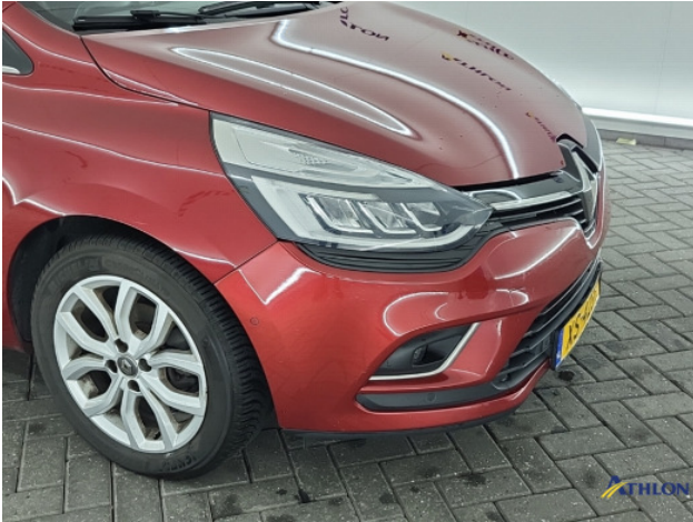
3. diverse Gebruikssporen