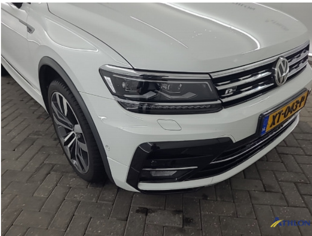
1. diverse shades Beschadigd