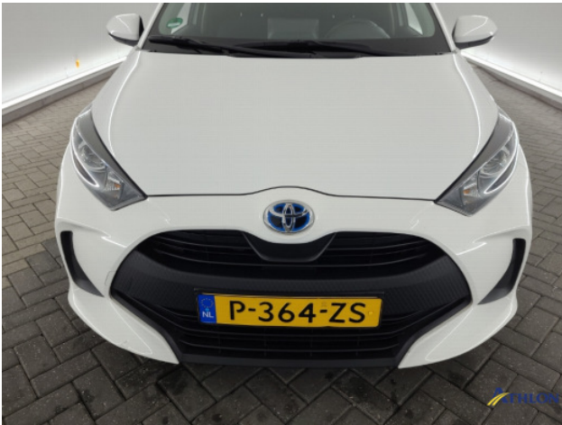
1. diverse schades Beschadigd