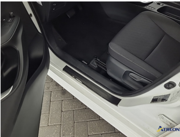
1. diverse schades Beschadigd