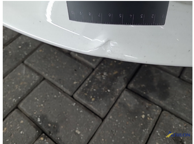
1. diverse schades Beschadigd