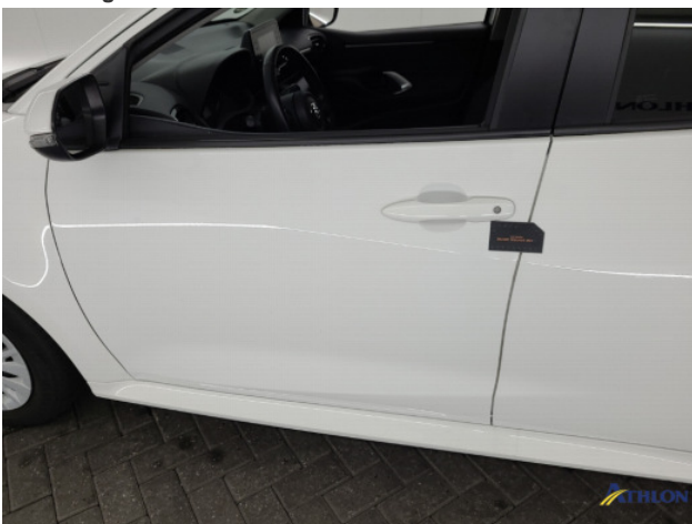
1. diverse schades Beschadigd