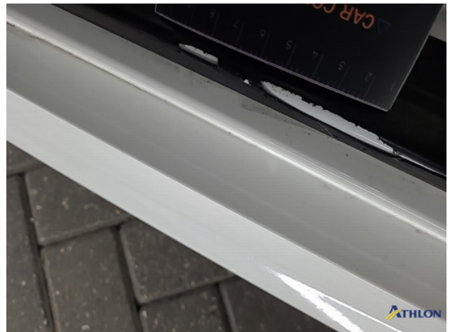
1. diverse schades Beschadigd