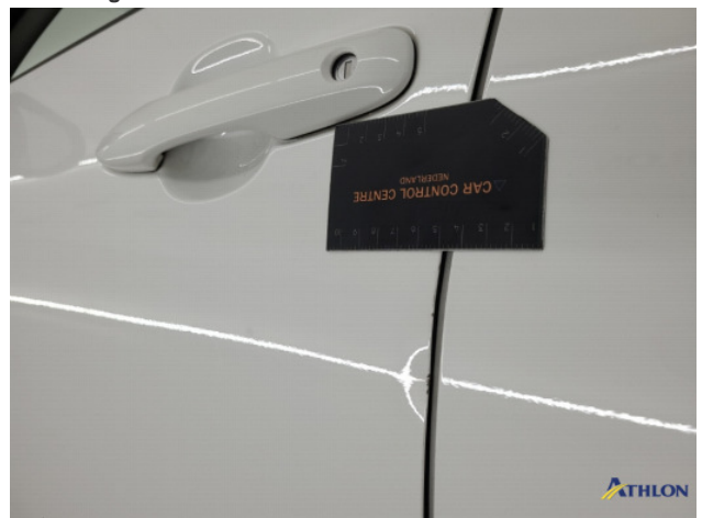
1. diverse schades Beschadigd