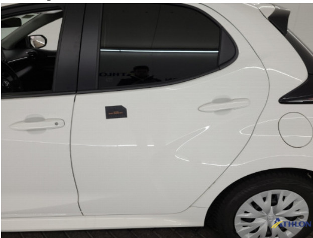
1. diverse schades Beschadigd