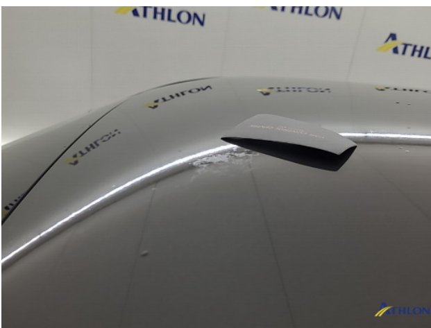
1. diverse schades Beschadigd