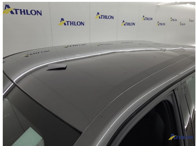
1. diverse schades Beschadigd