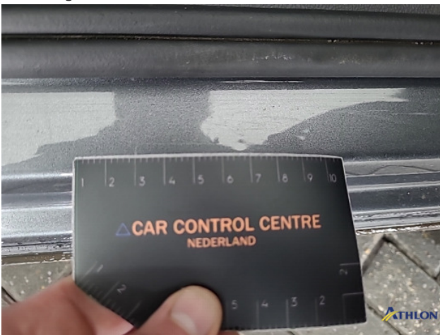
1. diverse schades Beschadigd