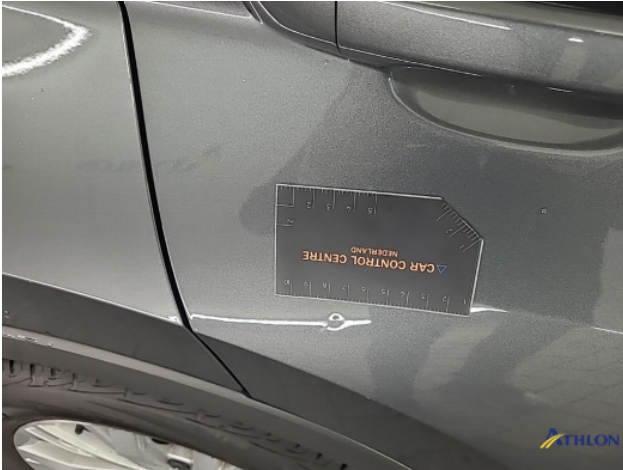
1. diverse schades Beschadigd