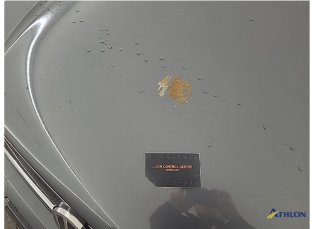
1. diverse schades Beschadigd