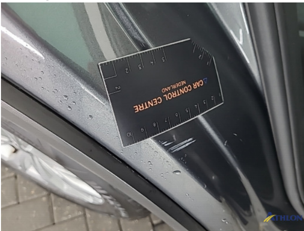
1. diverse schades Beschadigd