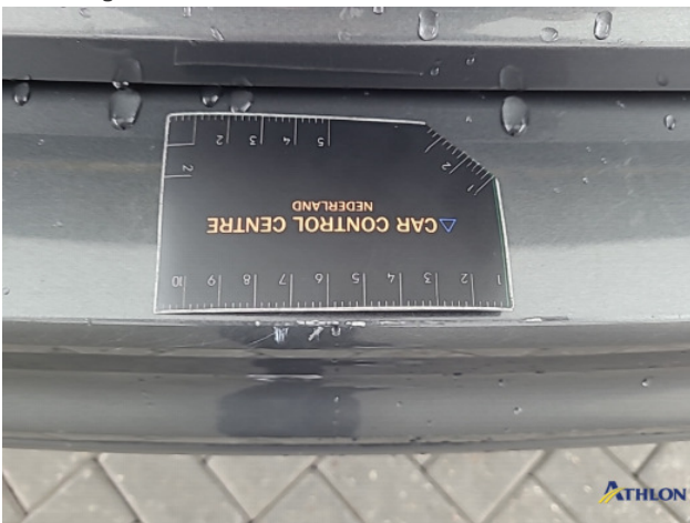
1. diverse schades Beschadigd