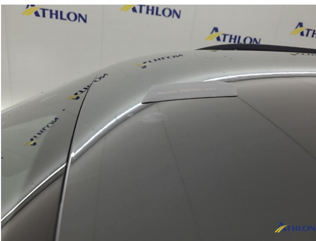
1. diverse schades