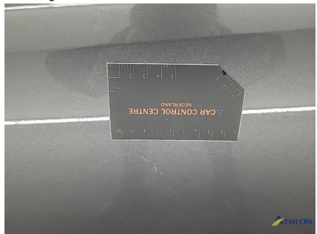
1. diverse schades Beschadigd