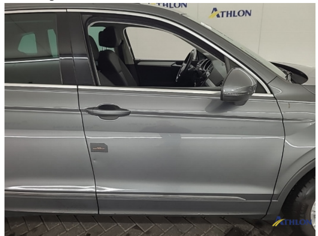
1. diverse schades Beschadigd