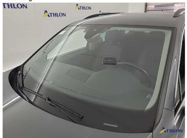
1. diverse schades