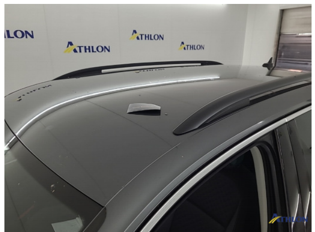
1. diverse schades