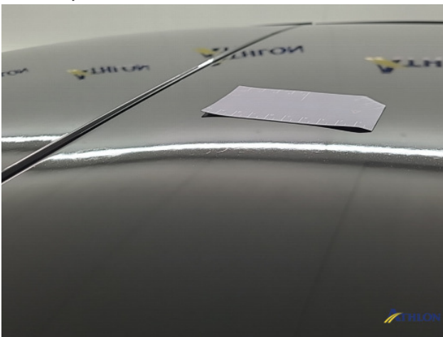
2. Oneffenheden lak Gebruikssporen