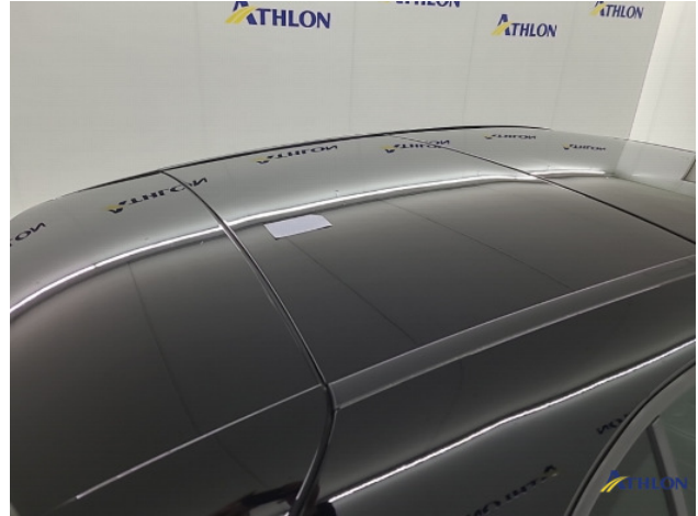
2. Oneffenheden lak Gebruikssporen