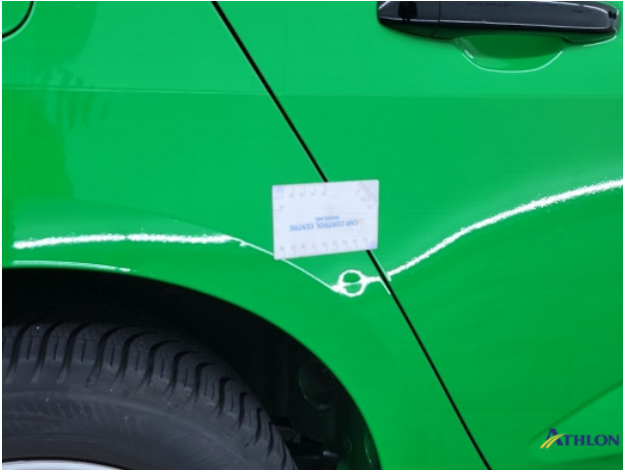
2. diverse andere Gebruikssporen