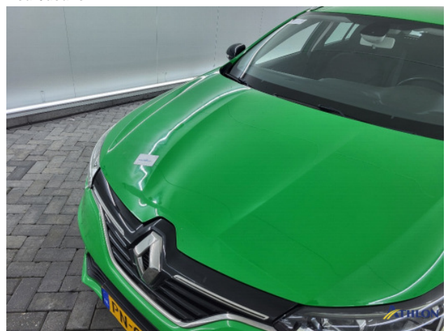
1. Motorkap Deuk/deuken