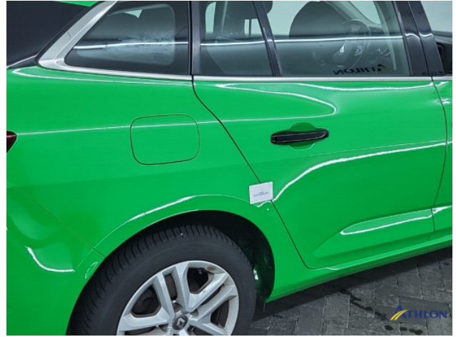
2. diverse andere Gebruikssporen