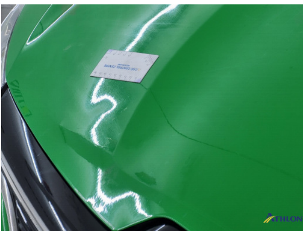
1. Motorkap Deuk/deuken