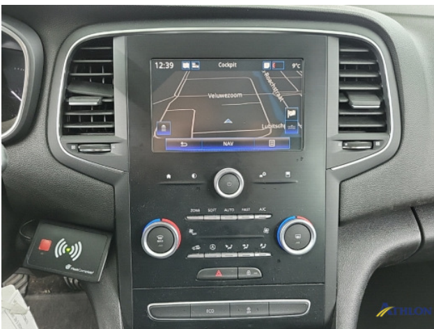
Navigatie of radio