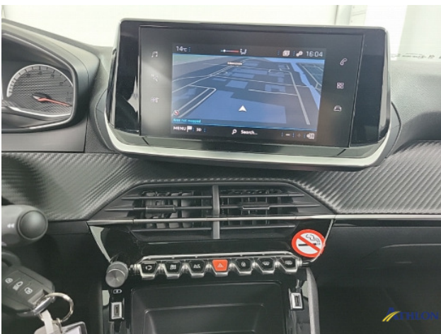
Navigatie of radio