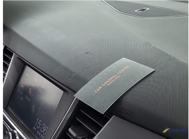
2. Dashboard Gebruikssporen