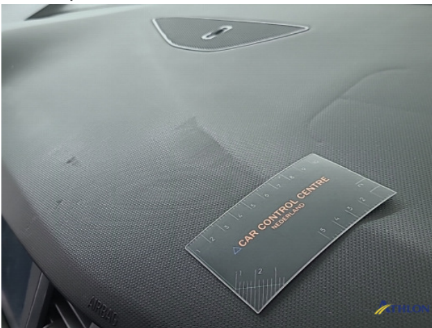
2. Dashboard Gebruikssporen