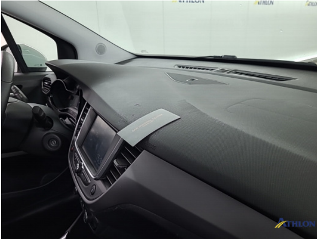
2. Dashboard Gebruikssporen