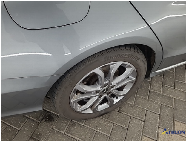
2. diverse Gebruikssporen