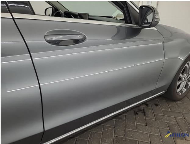
1. Portier voor - rechts Gebruikssporen