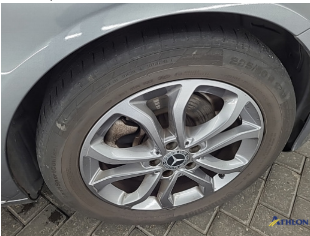
2. diverse Gebruikssporen