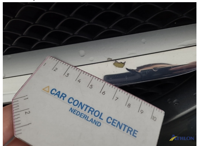
2. diverse Gebruikssporen