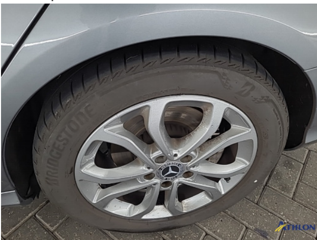
2. diverse Gebruikssporen