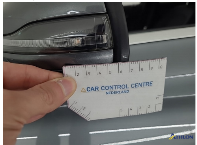
2. diverse Gebruikssporen