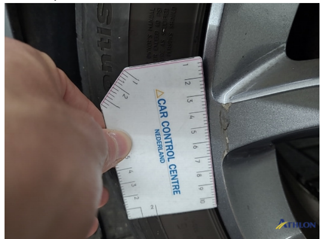
2. diverse Gebruikssporen