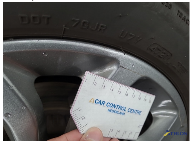
2. diverse Gebruikssporen