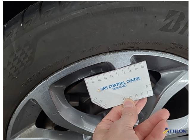
2. diverse Gebruikssporen