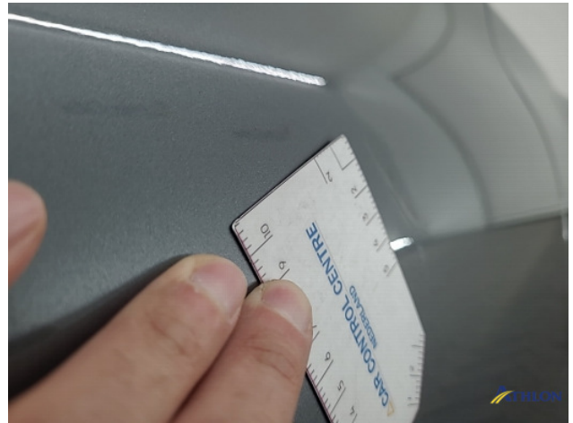
1. Portier voor - rechts Gebruikssporen