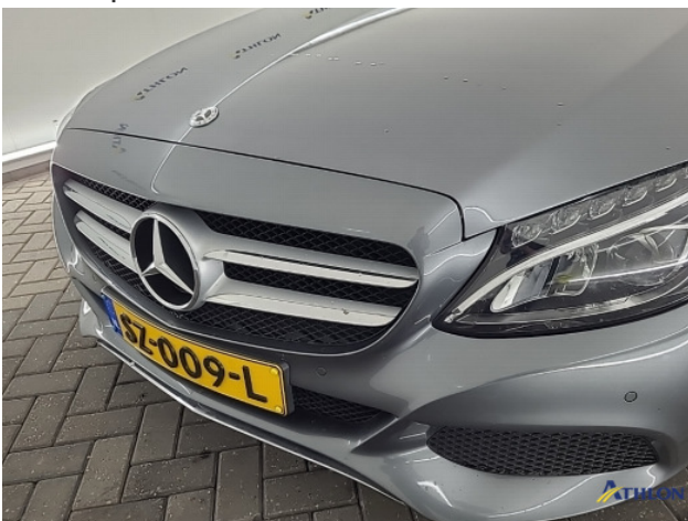
2. diverse Gebruikssporen