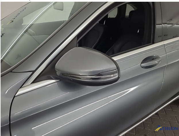
2. diverse Gebruikssporen