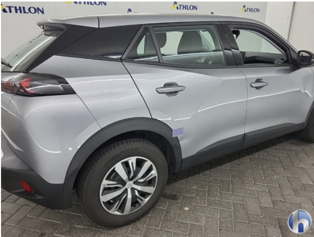
1. diverse Gebruikssporen - Aanvaardbaar