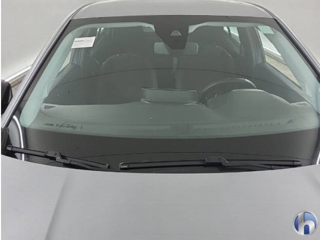
1. diverse Gebruikssporen - Aanvaardbaar