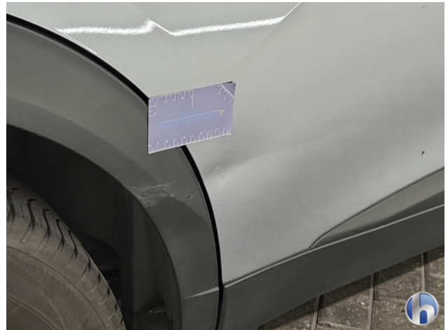
1. diverse Gebruikssporen - Aanvaardbaar