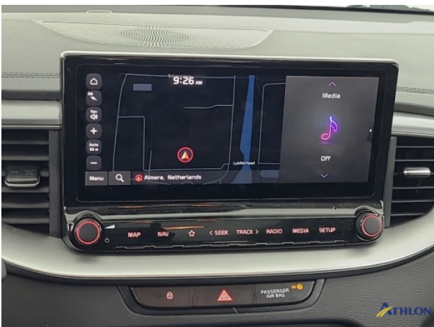
Navigatie of radio