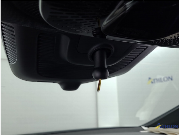
2. binnenspiegel Ontbreekt