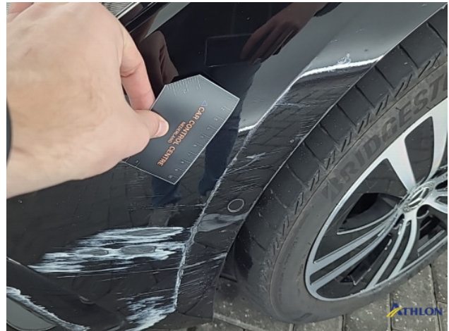
1. Voorbumper Schaafplek