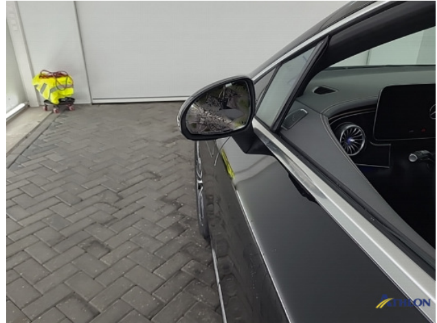
3. linker buiten spiegel Beschadigd