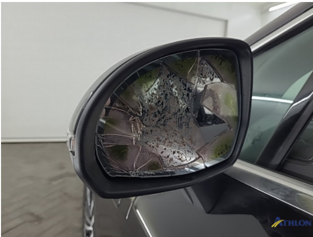
3. linker buiten spiegel Beschadigd