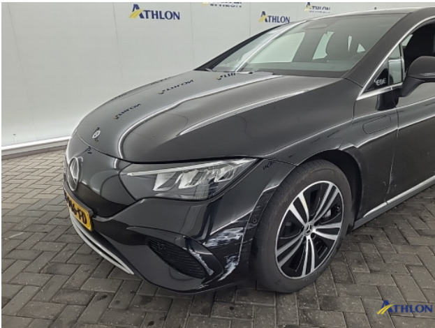
1. Voorbumper Schaafplek