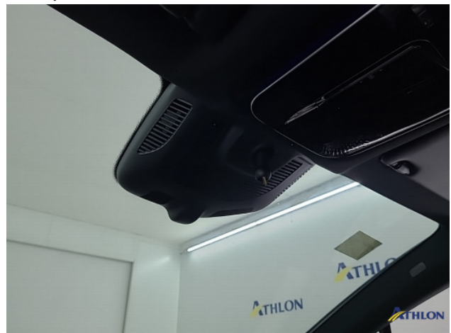
2. binnenspiegel Ontbreekt