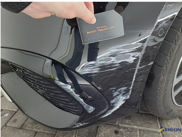
1. Voorbumper Schaafplek