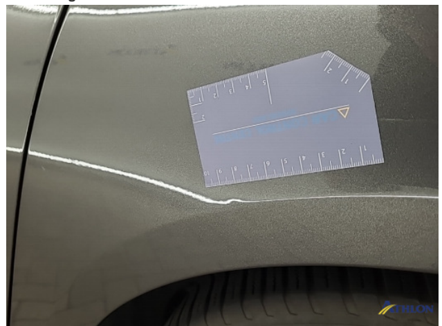
1. diverse schades Beschadigd