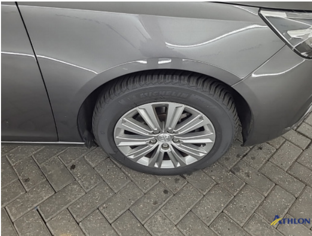
1. diverse schades Beschadigd