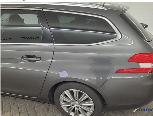
1. diverse schades Beschadigd