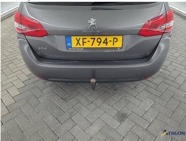
1. diverse schades Beschadigd