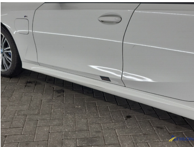
1. Dorpel - links Krassen