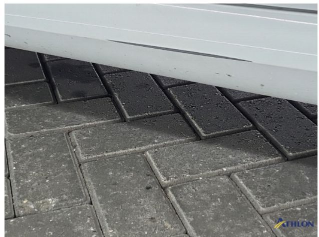
1. Dorpel - links Krassen