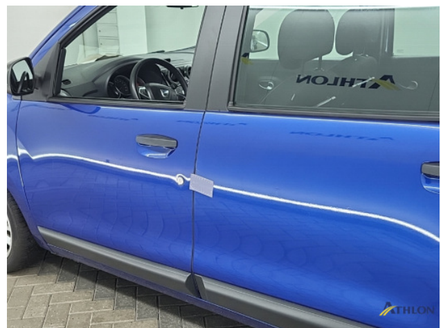
1. diverse andere Gebruikssporen