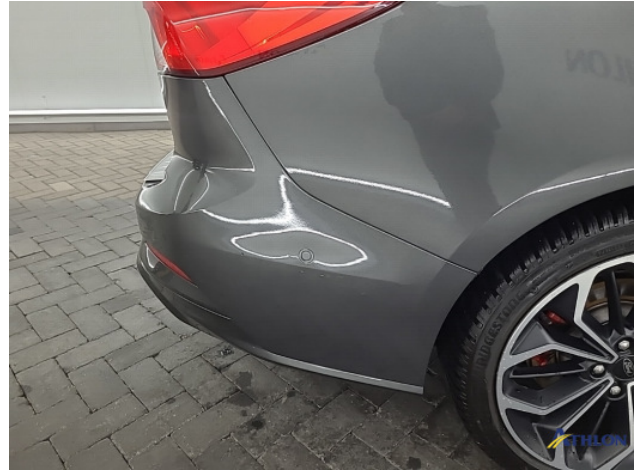
1. Achterbumper Krassen