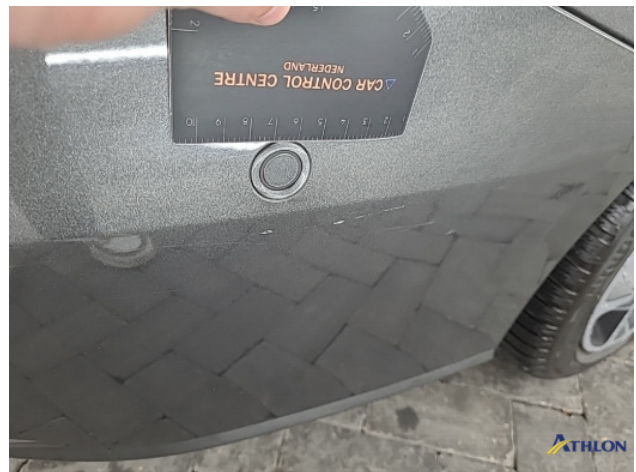
1. Achterbumper Krassen