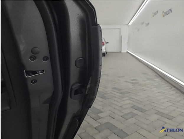
3. deur beschermer links achter Ontbreekt