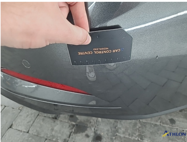
1. Achterbumper Krassen