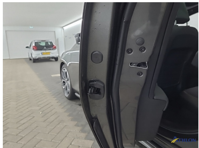
3. deur beschermer links achter Ontbreekt