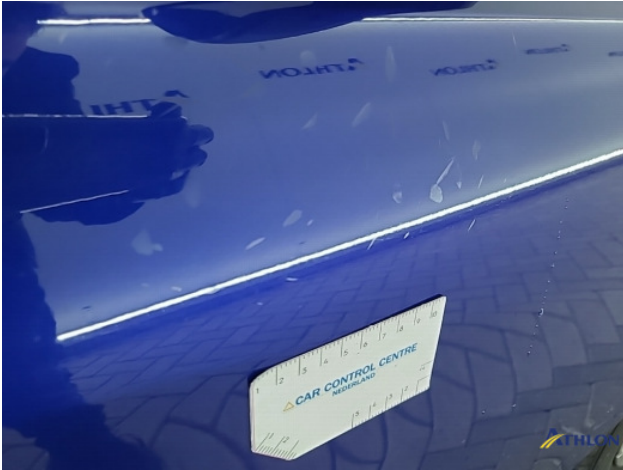
1. Divers Gebruikssporen