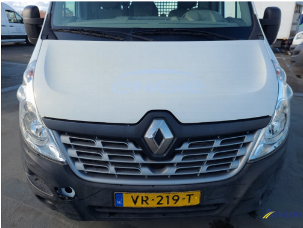
8. Roest rondom Beschadigd