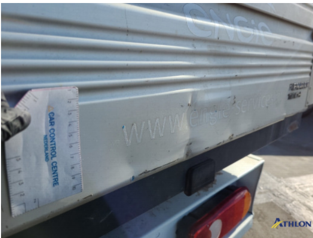
5. Achterklep Deuk/deuken