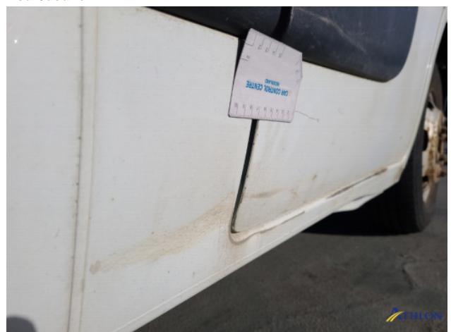
1. Portier voor - rechts Deuk/deuken