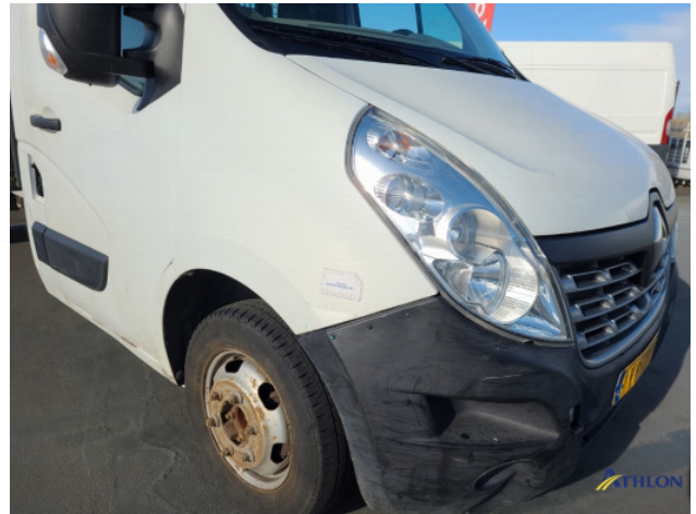
3. Voorscherm - rechts Deuk/deuken