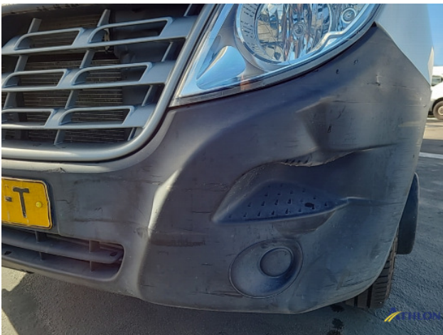
2. Voorbumper Deuk/deuken