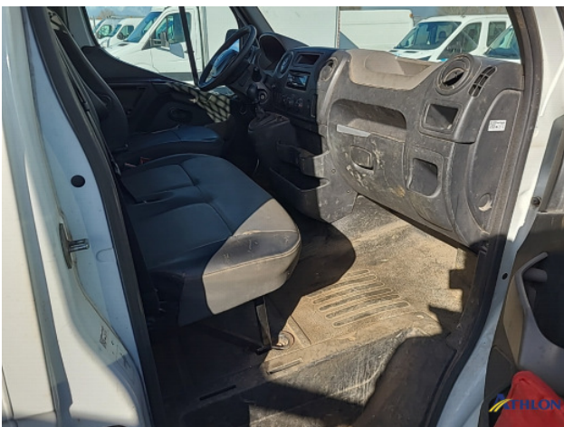
7. Diverse itnerieurelen Breuk / barst / scheur