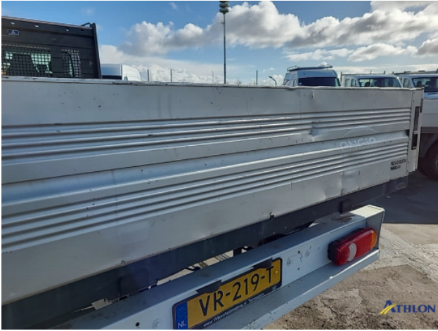
5. Achterklep Deuk/deuken