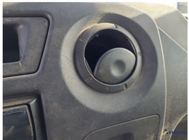
6. Ventilatioorosters interieur Gebruikssporen