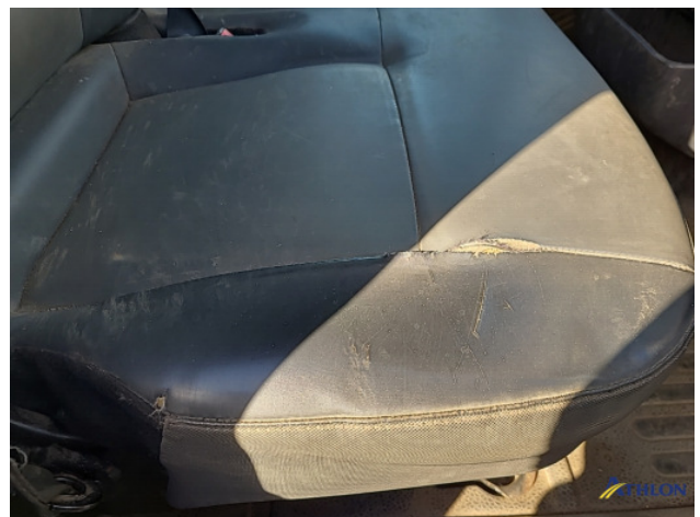
7. Diverse itnerieurelen Breuk / barst / scheur