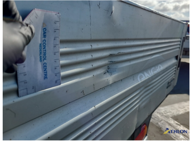
5. Achterklep Deuk/deuken