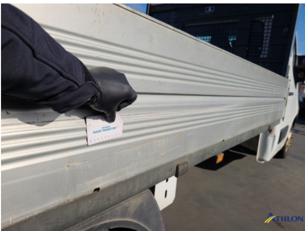
5. Achterklep Deuk/deuken