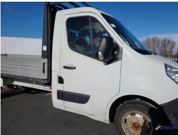
1. Portier voor - rechts Deuk/deuken