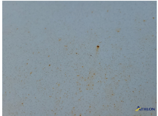
8. Roest rondom Beschadigd