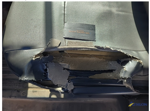
7. Diverse itnerieurelen Breuk / barst / scheur