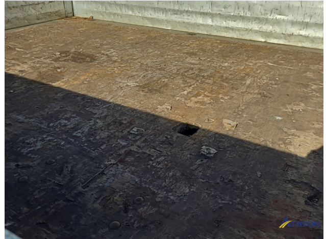
9. Laadbak Gebruikssporen