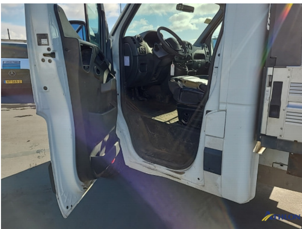
4. Dorpel - links Krassen