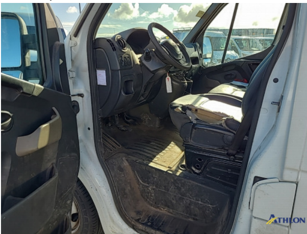
7. Diverse itnerieurelen Breuk / barst / scheur