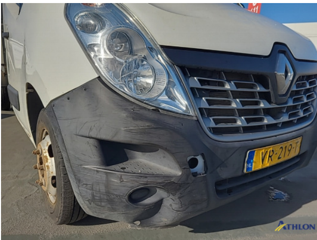
3. Voorscherm - rechts Deuk/deuken