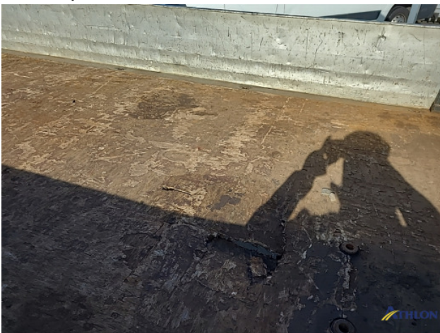
9. Laadbak Gebruikssporen