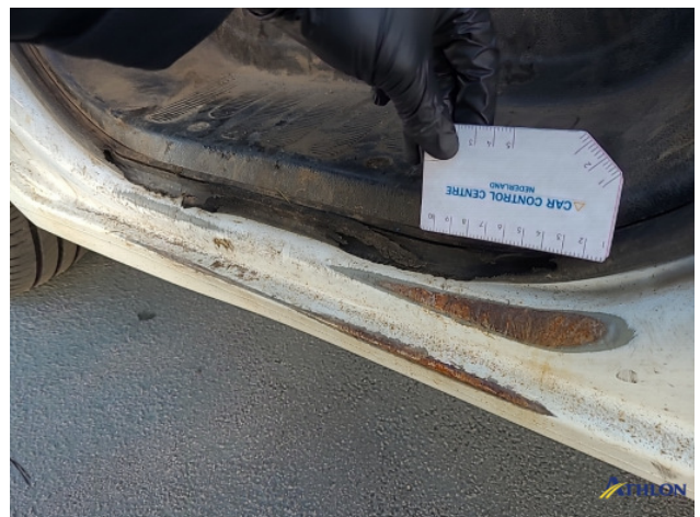
4. Dorpel - links Krassen