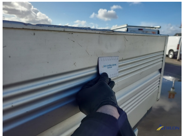
5. Achterklep Deuk/deuken