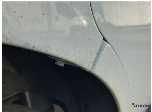
8. Roest rondom Beschadigd