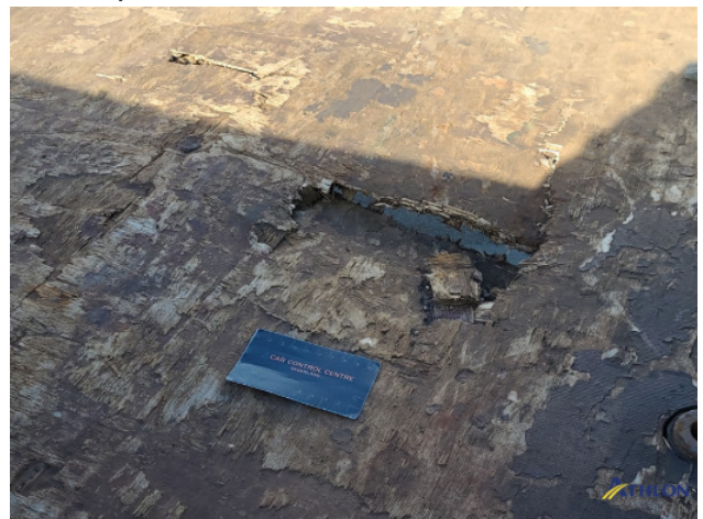
9. Laadbak Gebruikssporen