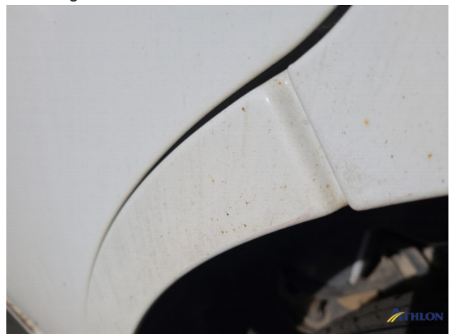
8. Roest rondom Beschadigd