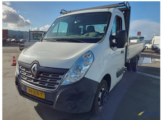
2. Voorbumper Deuk/deuken