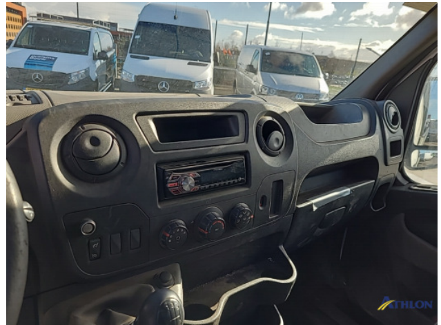
6. Ventilatioosters interieur Gebruikssporen