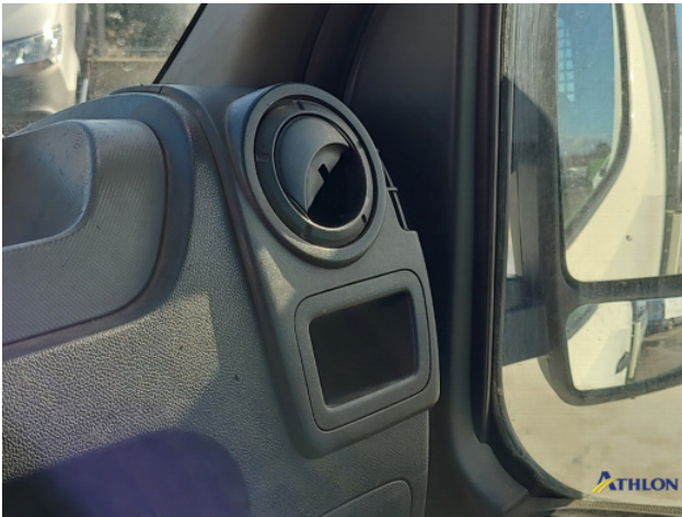
6. Ventilatioosters interieur Gebruikssporen