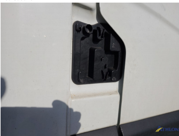
1. Portier voor - rechts Deuk/deuken