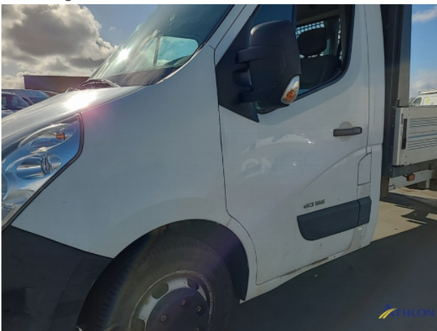
8. Roest rondom Beschadigd