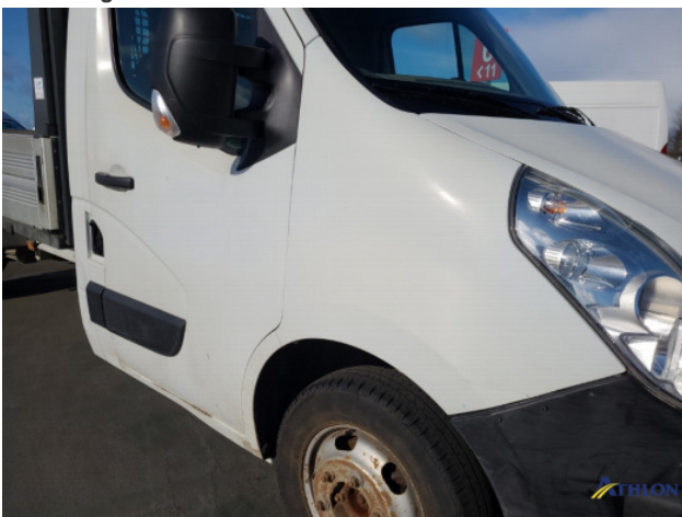
8. Roest rondom Beschadigd