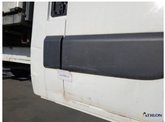
1. Portier voor - rechts Deuk/deuken