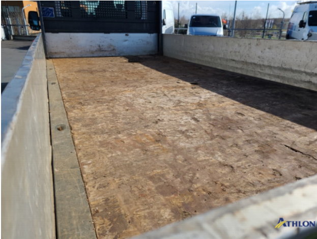
9. Laadbak Gebruikssporen