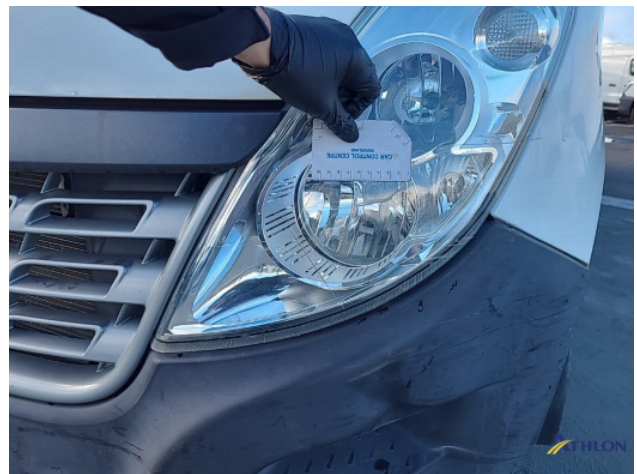
2. Voorbumper Deuk/deuken