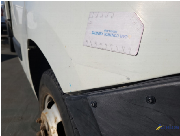
3. Voorscherm - rechts Deuk/deuken