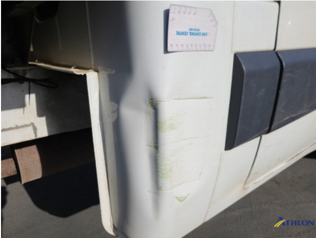
1. Portier voor - rechts Deuk/deuken