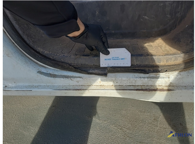
1. Portier voor - rechts Deuk/deuken