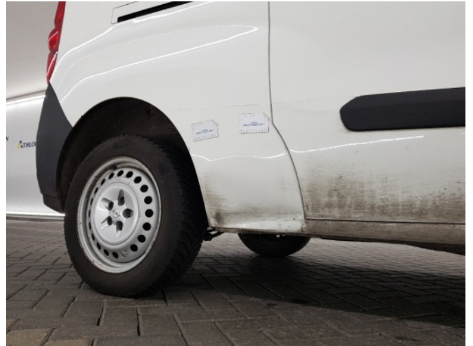
1. Zijwand - achter - rechts