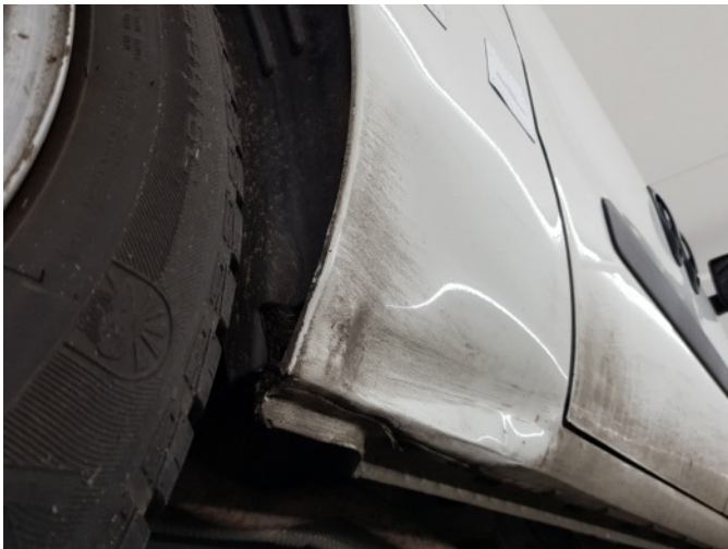
1. Zijwand - achter - rechts