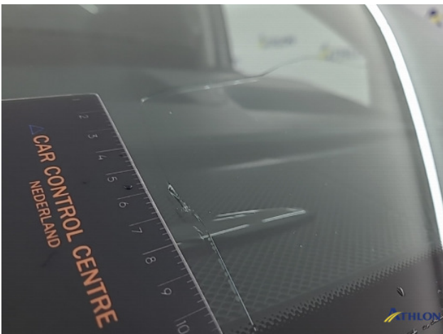
1. Voorruit Breuk / barst / scheur