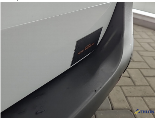
3. Achterbumper Breuk / barst / scheur