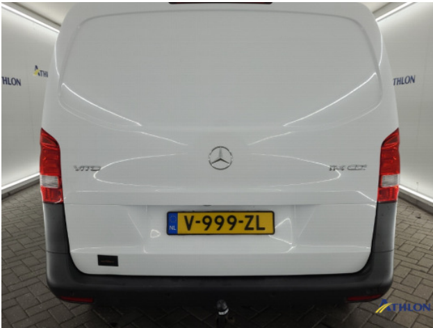
4. Achterklep Deuk/deuken