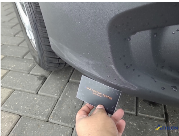
2. Voorbumper Schaafplek