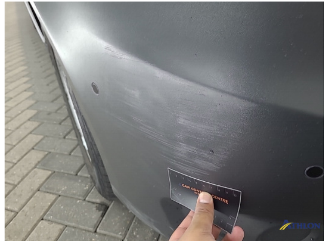
2. Voorbumper Schaafplek