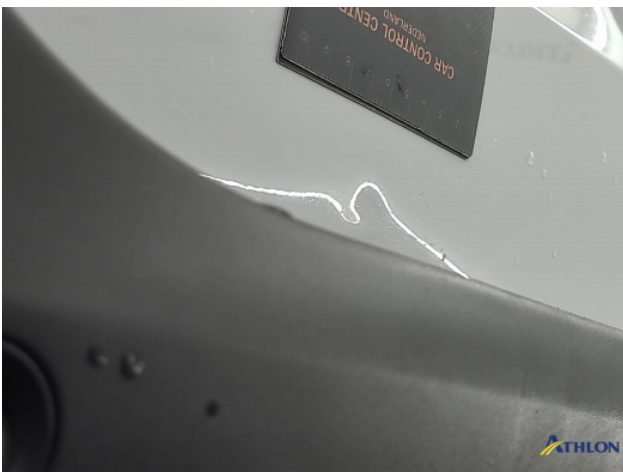
4. Achterklep Deuk/deuken