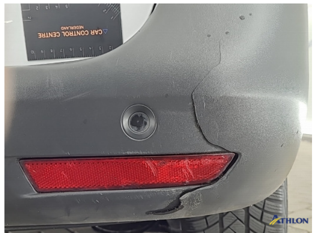
3. Achterbumper Breuk / barst / scheur