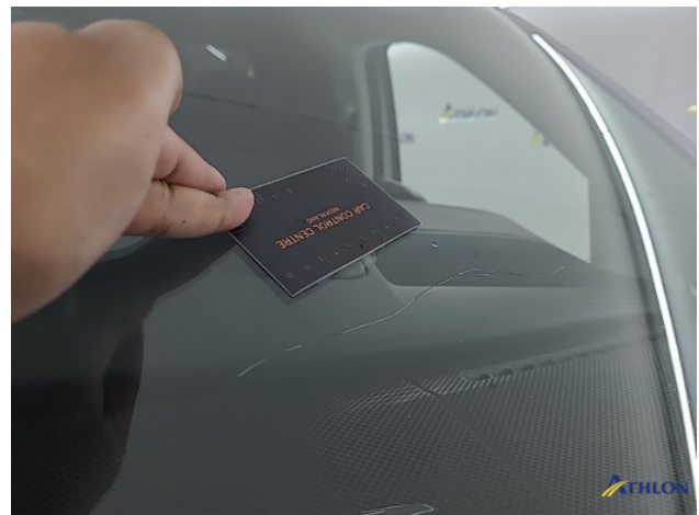
1. Voorruit Breuk / barst / scheur