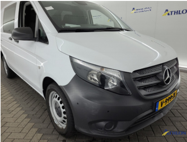
2. Voorbumper Schaafplek