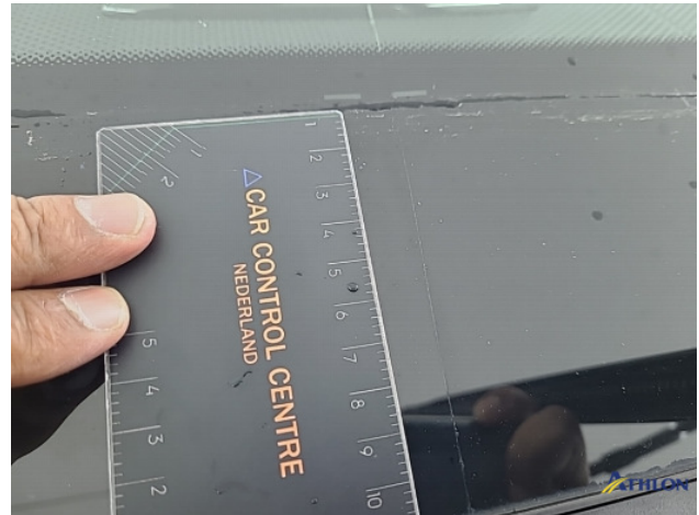
1. Voorruit Breuk / barst / scheur