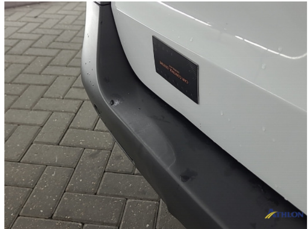
4. Achterklep Deuk/deuken