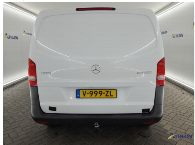
3. Achterbumper Breuk / barst / scheur