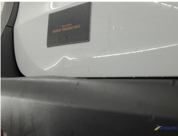
4. Achterklep Deuk/deuken