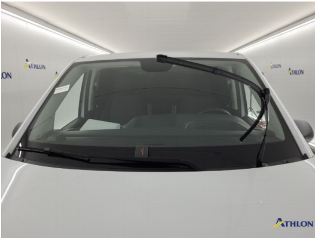
1. Voorruit Breuk / barst / scheur