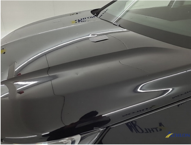
1. Motorkap Hagelschade