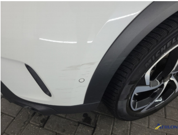
1. Voorscherm - links Krassen