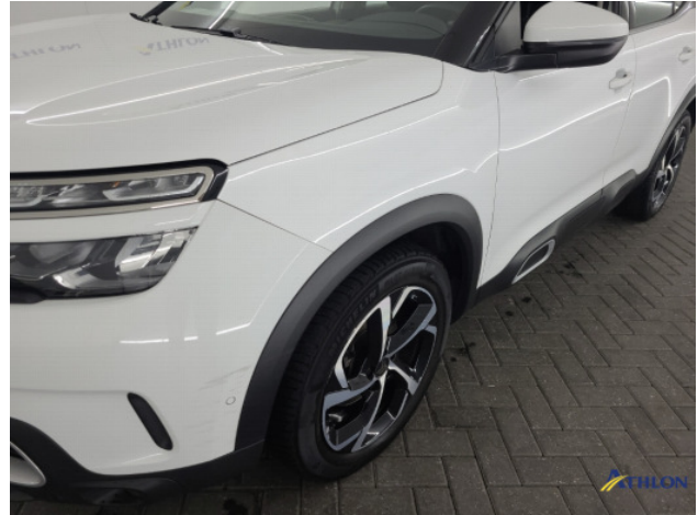
1. Voorscherm - links Krassen