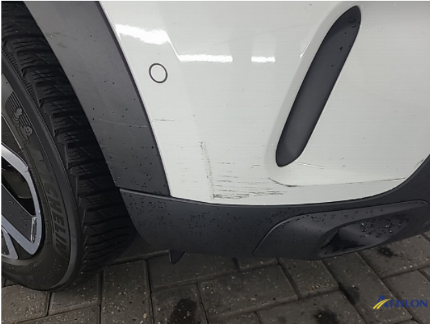
3. Voorbumper Krassen