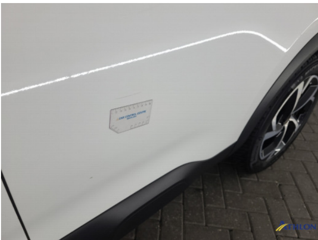
4. diverse Gebruikssporen