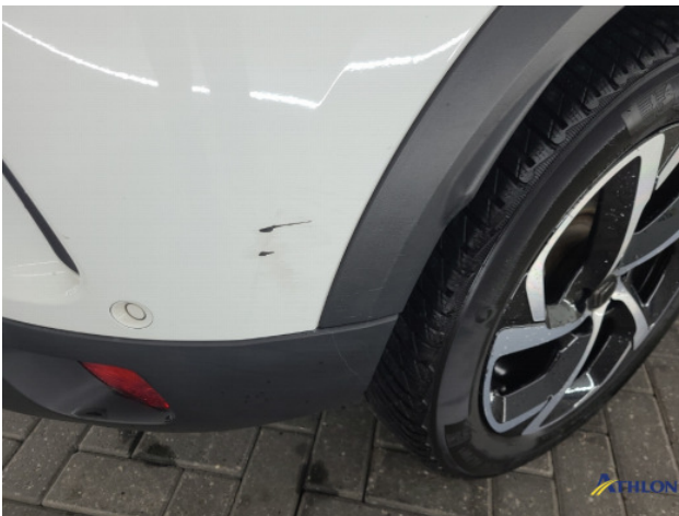
2. Zijwand - achter - rechts Krassen