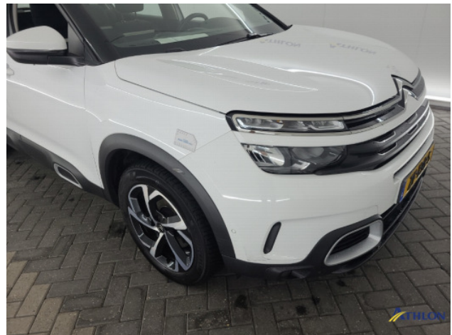
3. Voorbumper Krassen