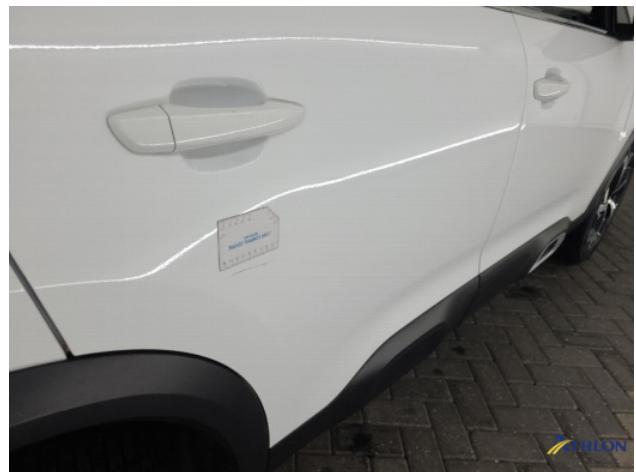
4. diverse Gebruikssporen