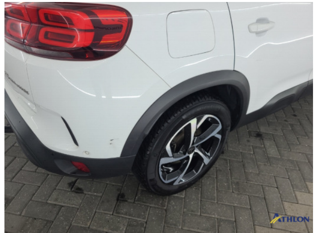
2. Zijwand - achter - rechts Krassen