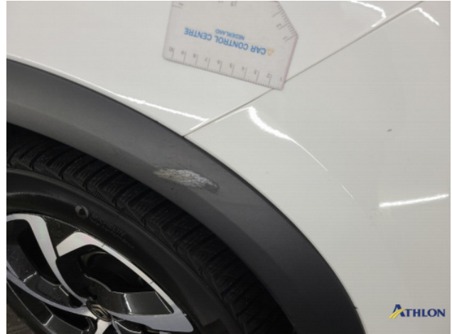
3. Voorbumper Krassen