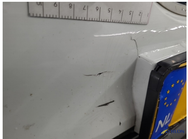
1. Voorbumper Breuk / barst / scheur