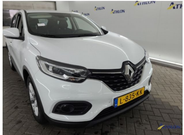
1. Voorbumper Breuk / barst / scheur