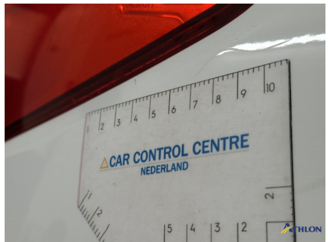
2. diverse Gebruikssporen