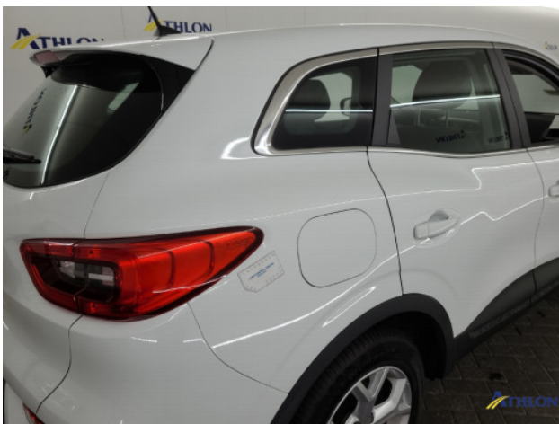
2. diverse Gebruikssporen