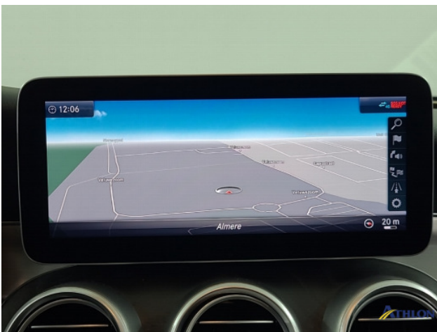
Navigatie of radio