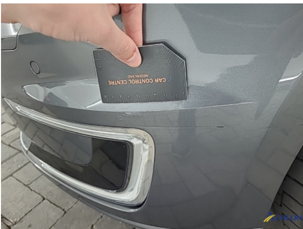
1. Voorbumper Gebruikssporen