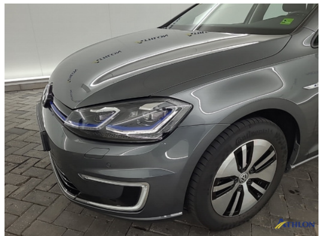
1. Voorbumper Gebruikssporen