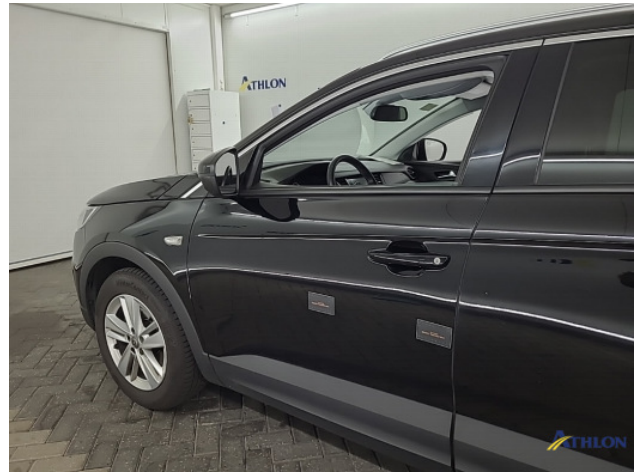
1. Portier voor - links