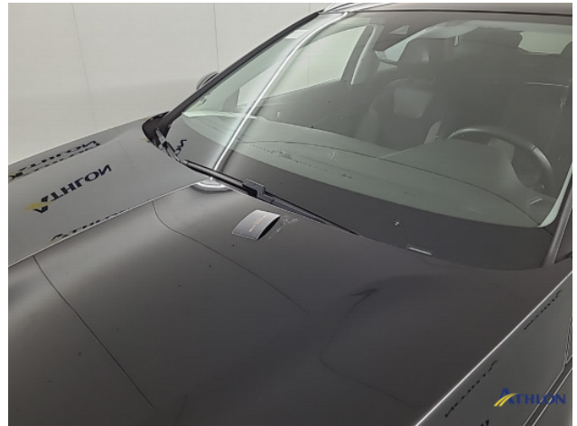
2. diverse Gebruikssporen