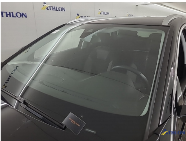
2. diverse Gebruikssporen