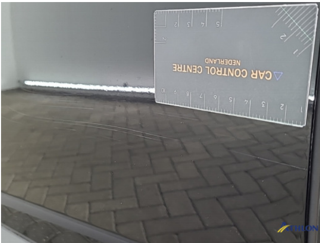
1. Portier voor - links Krassen