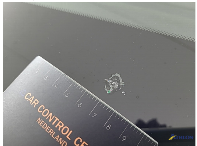
2. diverse Gebruikssporen