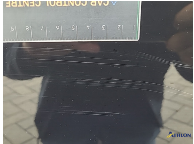
1. Portier voor - links Krassen