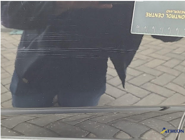
1. Portier voor - links Krassen