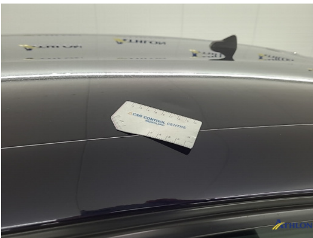
2. Dak Deuk/deuken