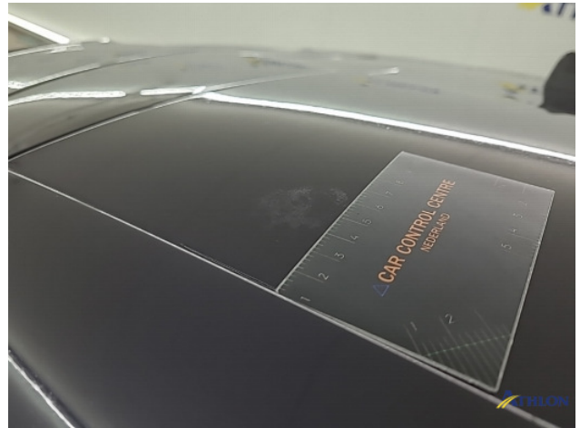
6. diverse Gebruikssporen