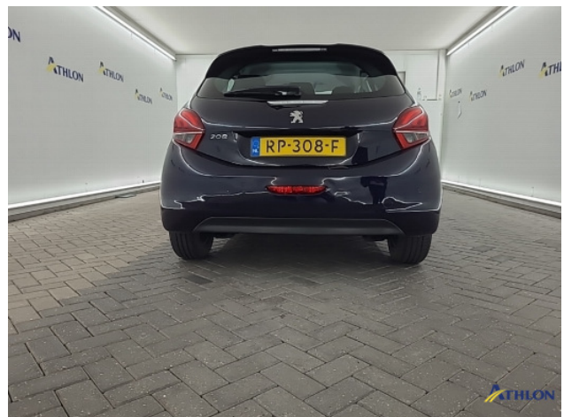
3. Achterbumper Deuk/deuken