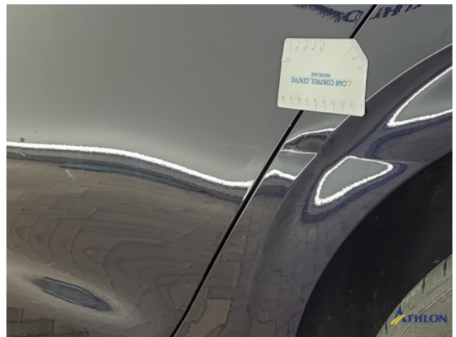
4. Zijwand - achter - Links Deuk/deuken