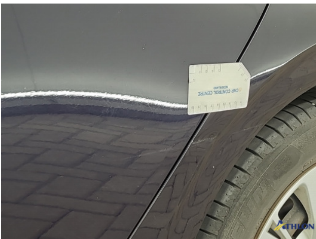
4. Zijwand - achter - Links Deuk/deuken