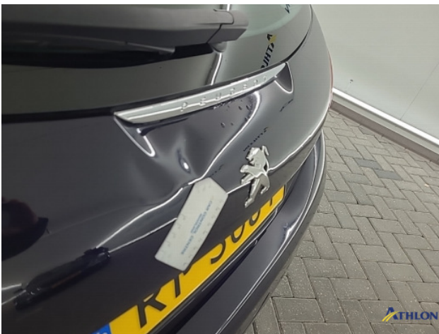
1. Achterklep Deuk/deuken