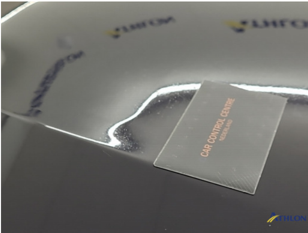
5. Motorkap Gebruikssporen