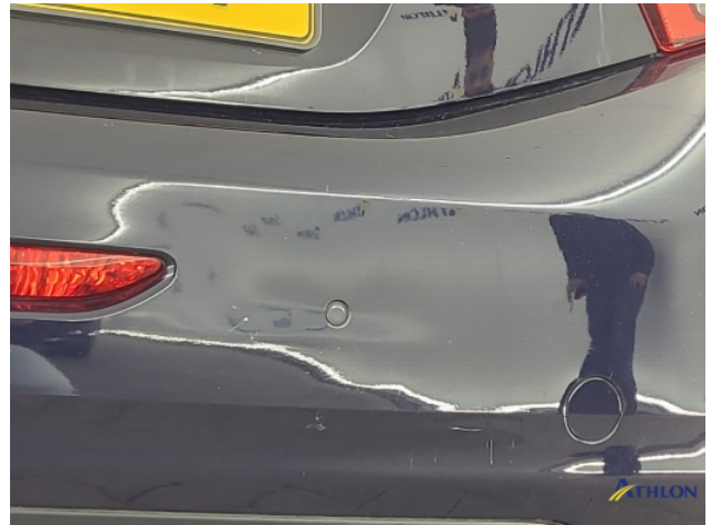
3. Achterbumper Deuk/deuken