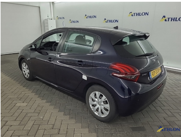
4. Zijwand - achter - Links Deuk/deuken