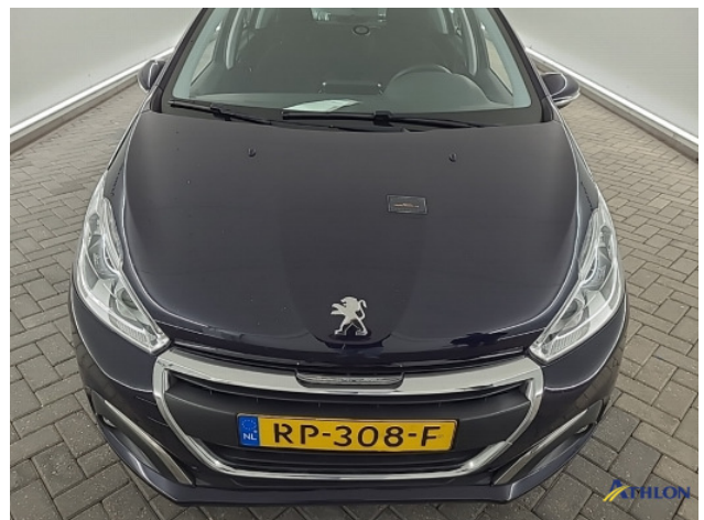
5. Motorkap Gebruikssporen