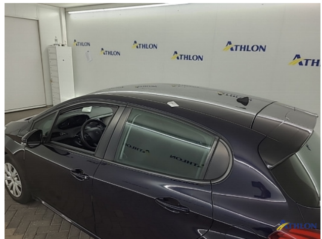
2. Dak Deuk/deuken