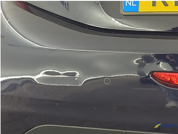
3. Achterbumper Deuk/deuken