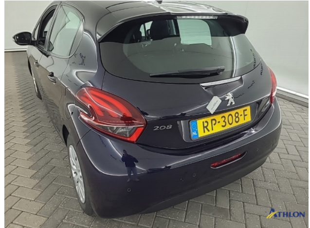
1. Achterklep Deuk/deuken