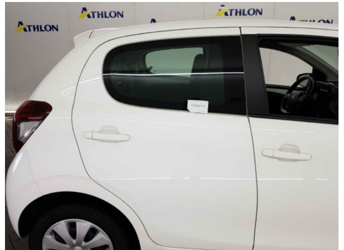
1. Zijruit - achter - rechts