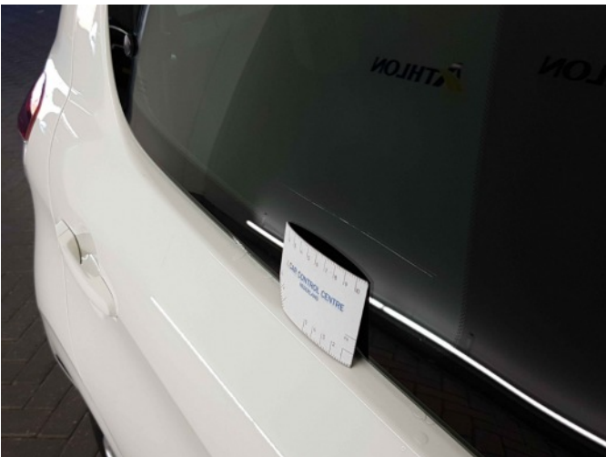
1. Zijruit - achter - rechts