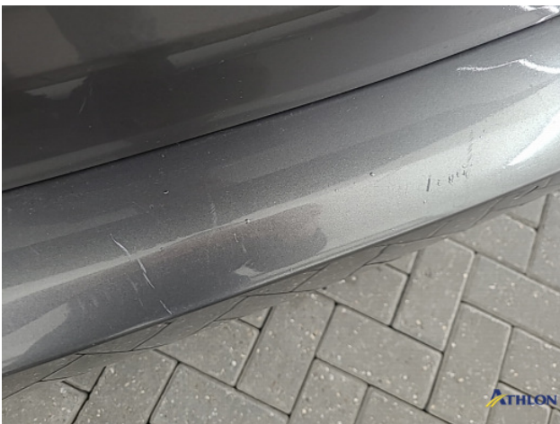
1. Achterbumper Krassen