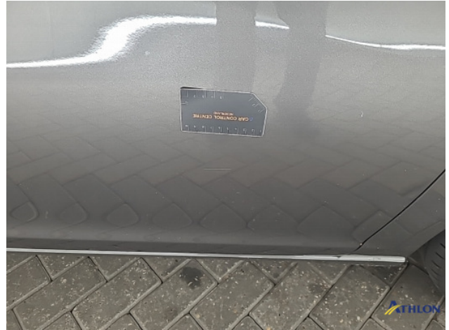
3. diverse Gebruikssporen