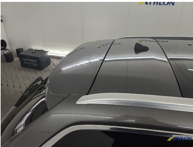
2. Dak Hagelschade