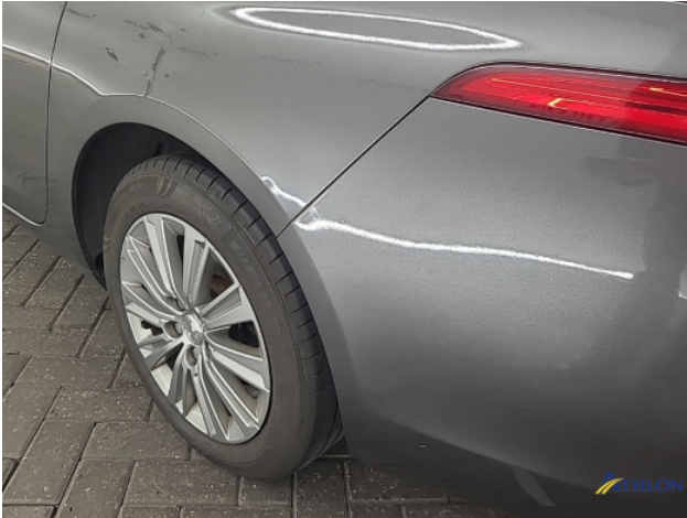
3. diverse Gebruikssporen