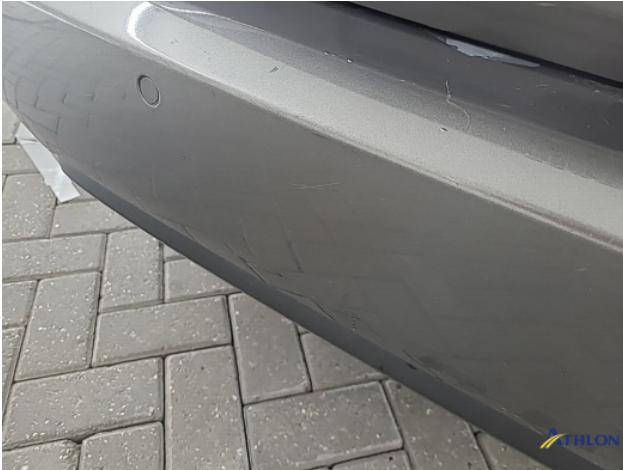
1. Achterbumper Krassen