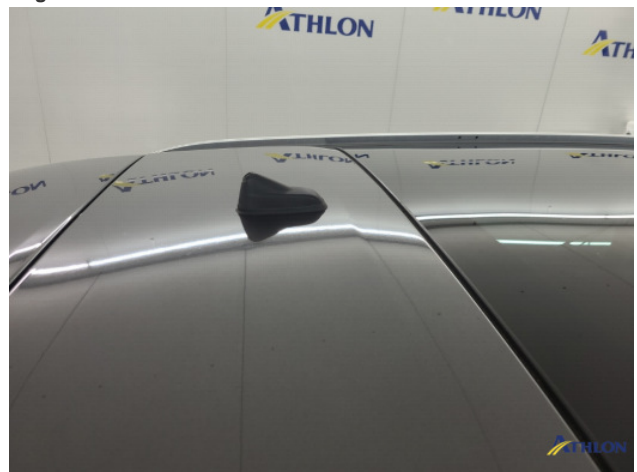
2. Dak Hagelschade