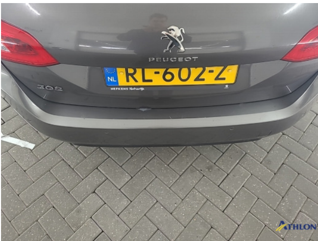
1. Achterbumper Krassen