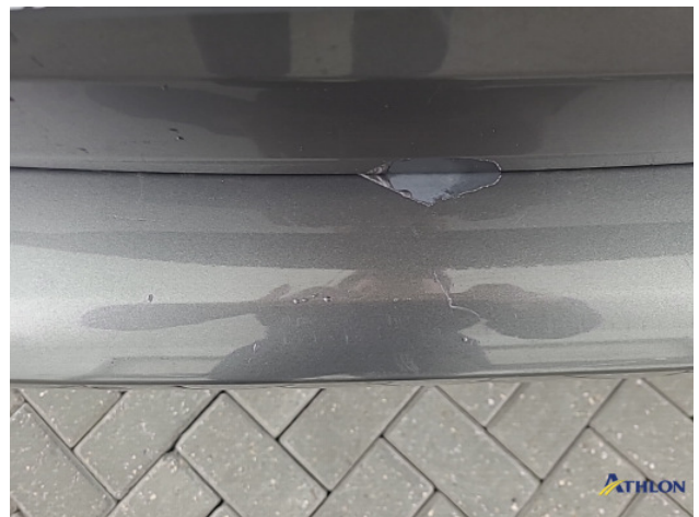
1. Achterbumper Krassen