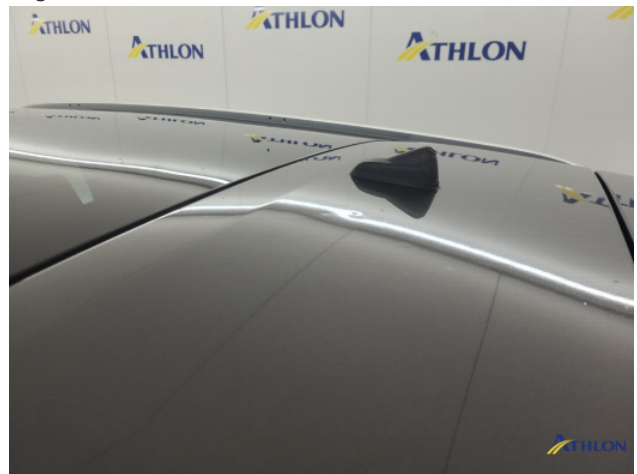
2. Dak Hagelschade