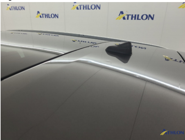
2. Dak Hagelschade