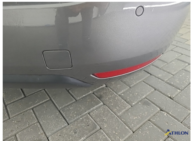
1. Achterbumper Krassen