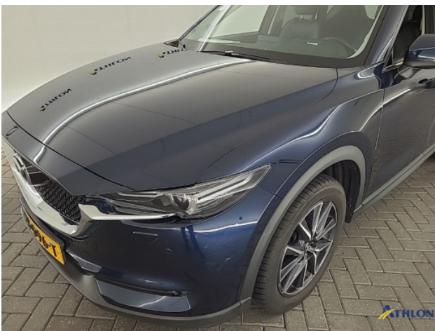
3. diverse Gebruikssporen