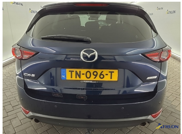
2. Achterbumper Krasen