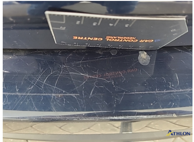
2. Achterbumper Krasen