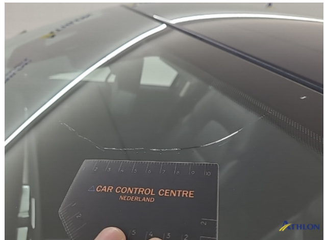
1. Voorruit Breuk / barst / scheur