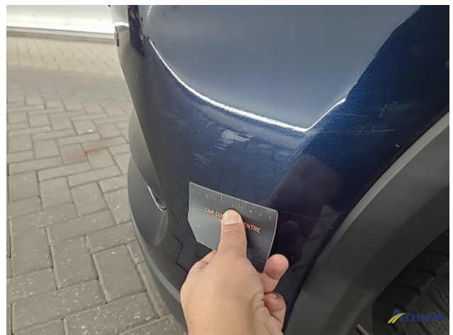
3. diverse Gebruikssporen