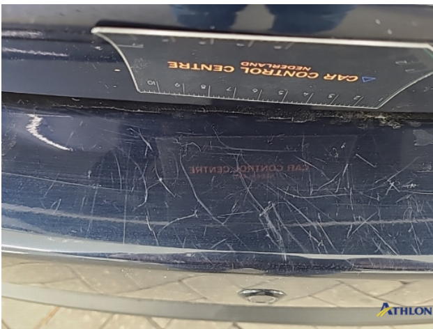
2. Achterbumper Krasen