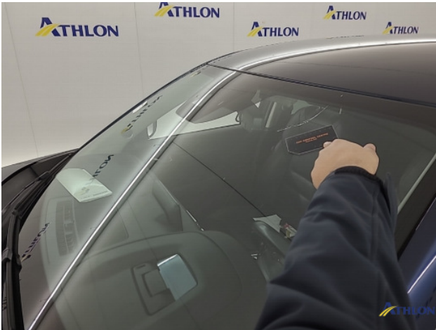
1. Voorruit Breuk / barst / scheur