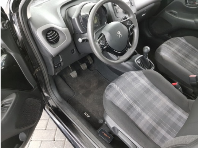
2. Diverse interieurdelen