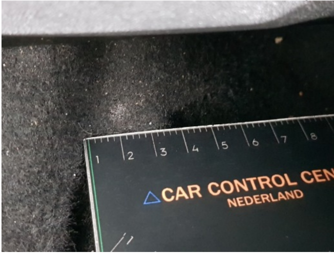
2. Diverse interieurdelen