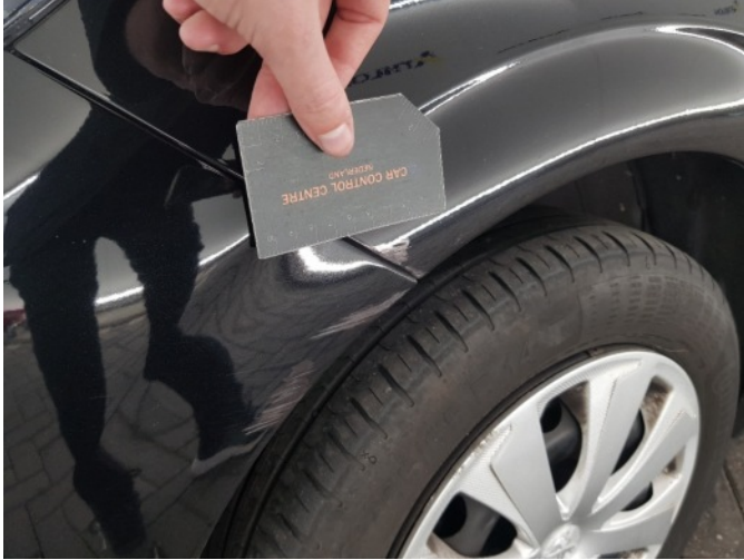
1. Spatbord voor- links