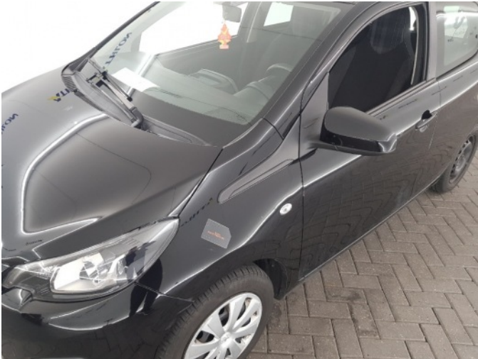
1. Spatbord voor- links