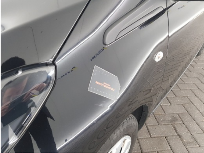
1. Spatbord voor- links