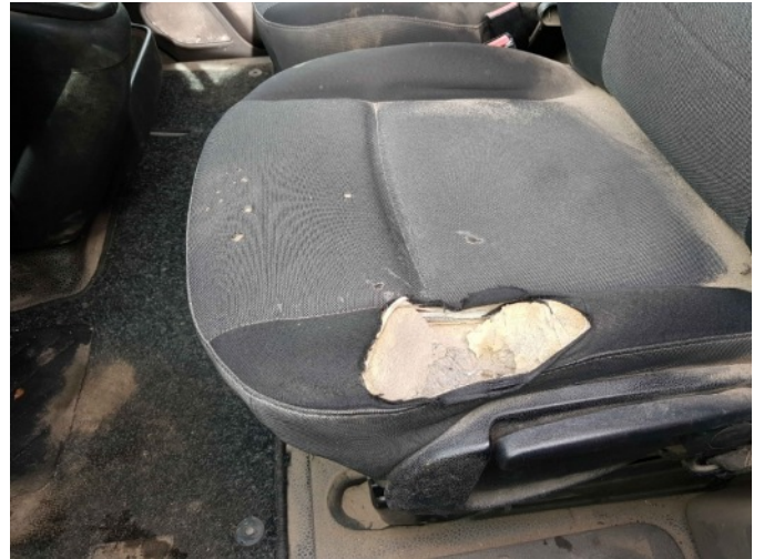
2. LV stoel