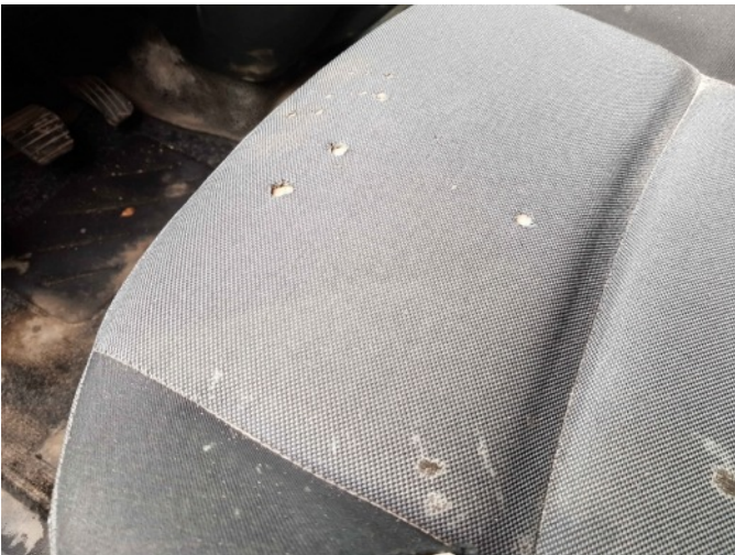
2. LV stoel