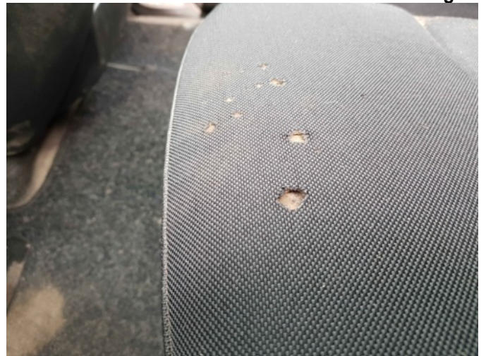
2. LV stoel