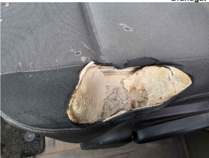
2. LV stoel