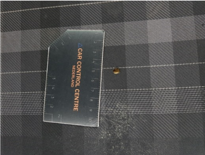
2. Diverse interieurdelen