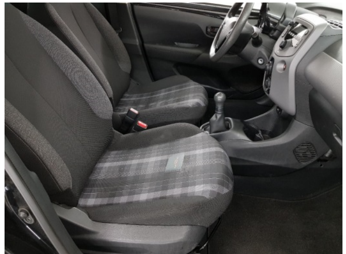
2. Diverse interieurdelen