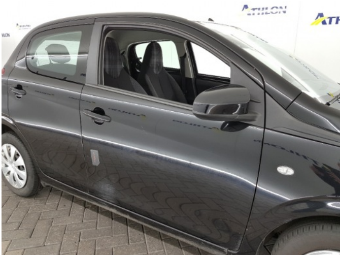
1. Portier voor - rechts