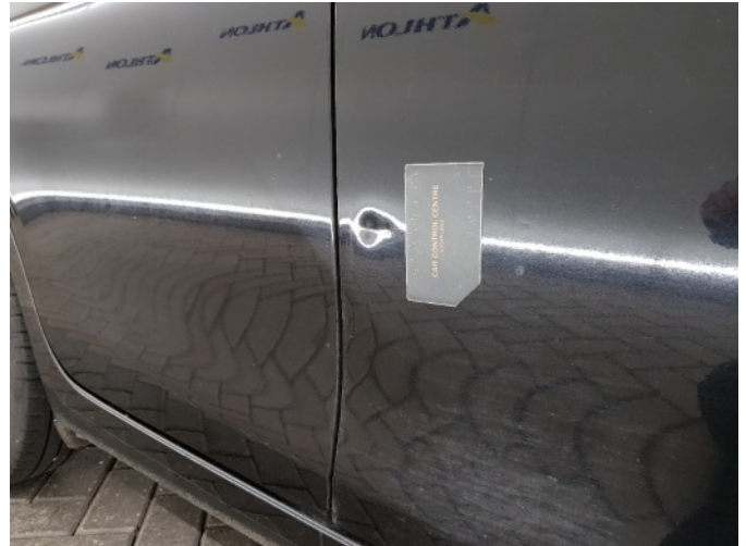
1. Portier voor - rechts