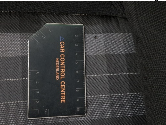
2. Diverse interieurdelen