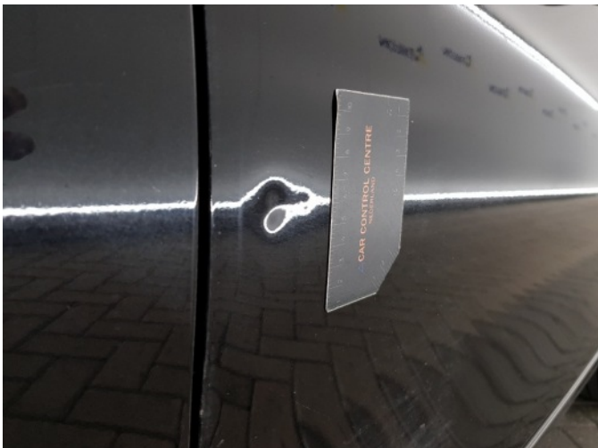
1. Portier voor - rechts