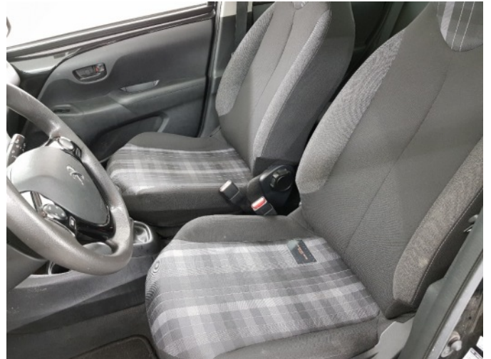
2. Diverse interieurdelen