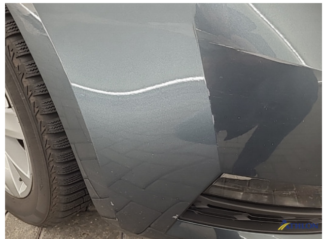
1. Voorbumper Krassen