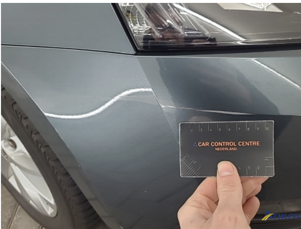
1. Voorbumper Krassen