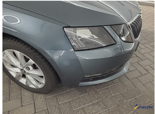
1. Voorbumper Krassen