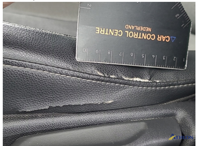
3. Diverse Interieurdele Gebruikssporen