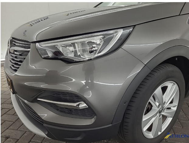
1. Voorbumper Schaafplek