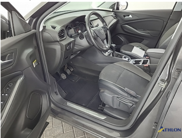
3. Diverse Interieurdele Gebruikssporen