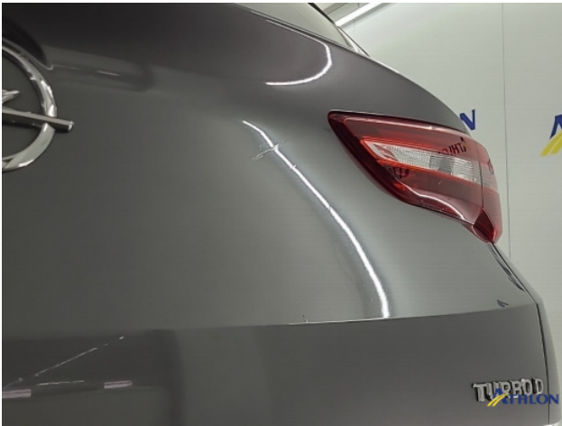
2. Achterklep Gebruikssporen