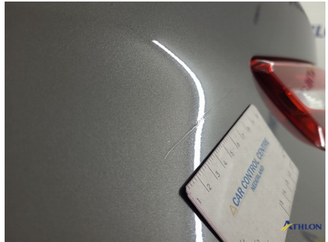
2. Achterklep Gebruikssporen