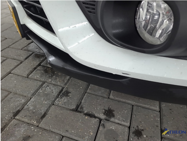
3. diverse Gebruikssporen