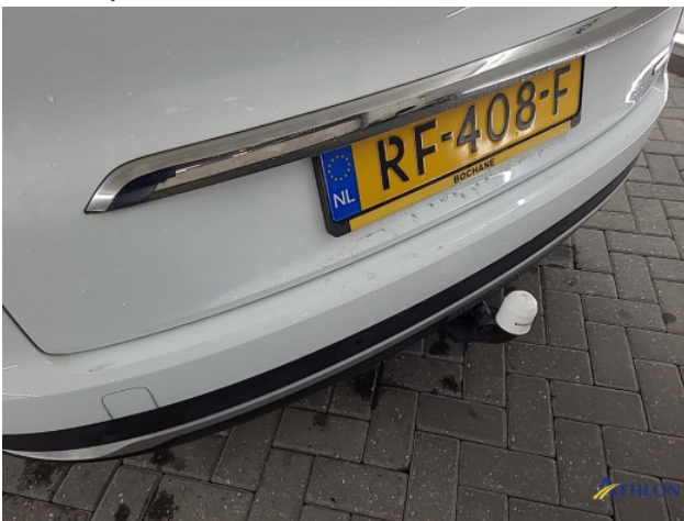
3. diverse Gebruikssporen