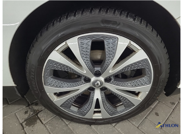
3. diverse Gebruikssporen