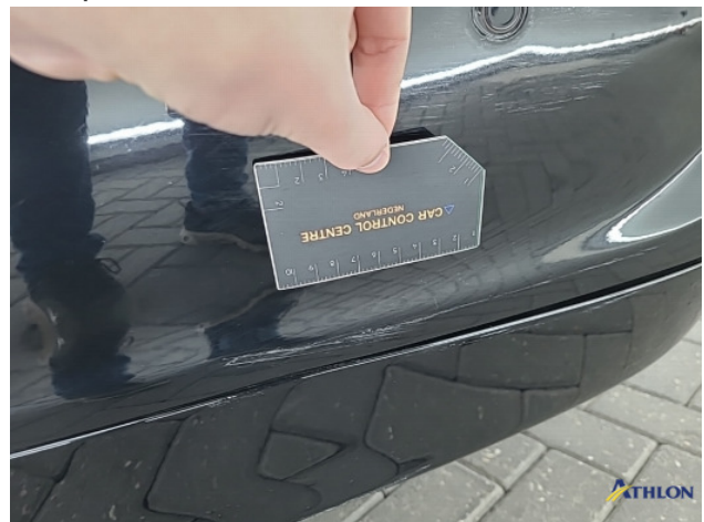
1. Achterbumper Schaafplek