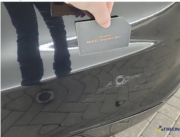
1. Achterbumper Schaafplek