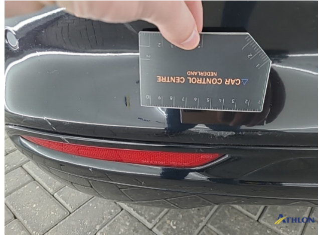
1. Achterbumper Schaafplek