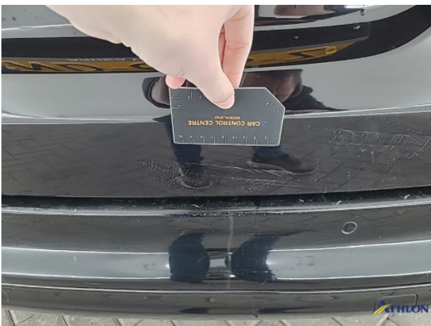
2. Achterklep Krassen