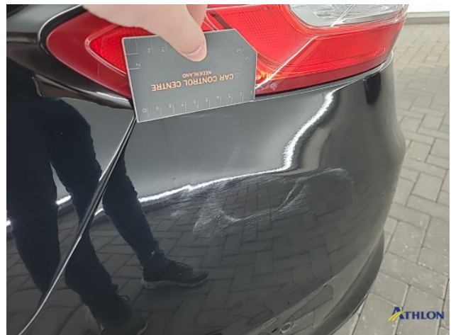
1. Achterbumper Schaafplek