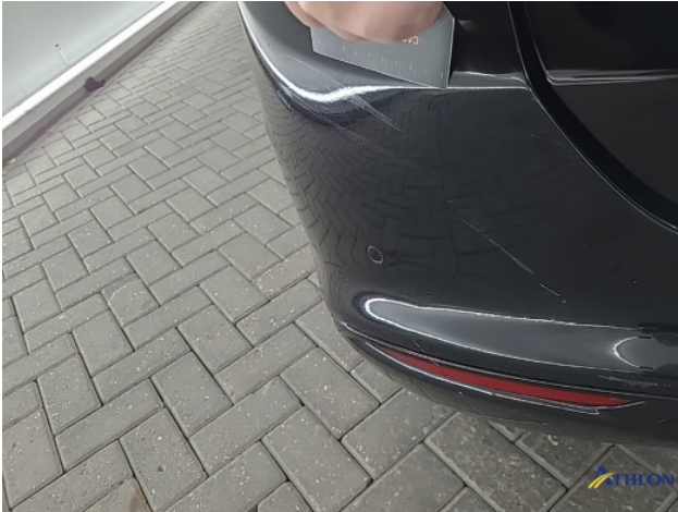
1. Achterbumper Schaafplek