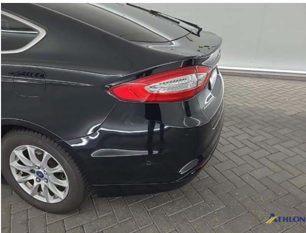
1. Achterbumper Schaafplek