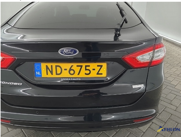
2. Achterklep Krassen