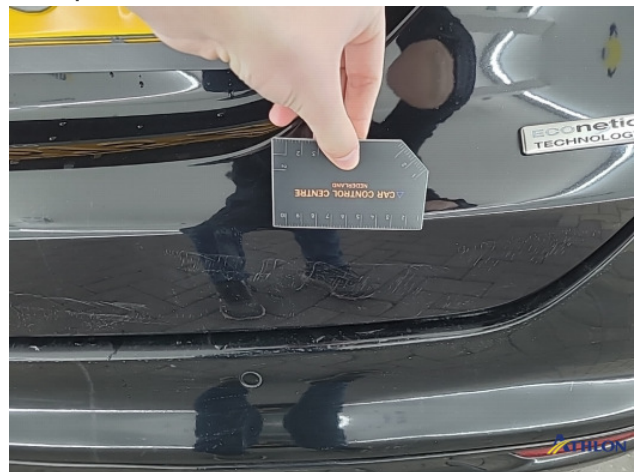
2. Achterklep Krassen