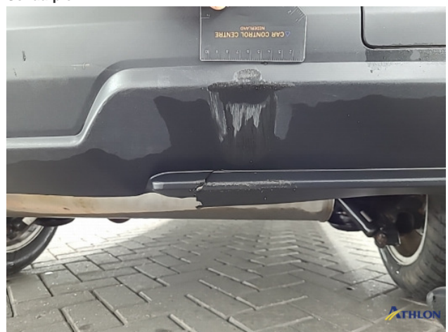
1. Achterbumper Schaafplek