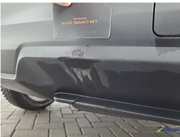
1. Achterbumper Schaafplek