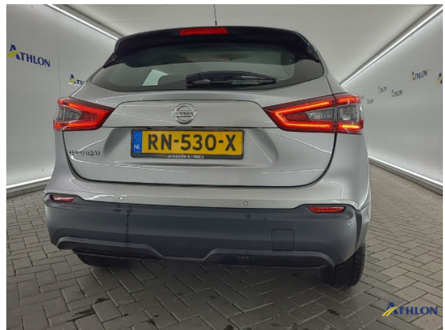
1. Achterbumper Schaafplek