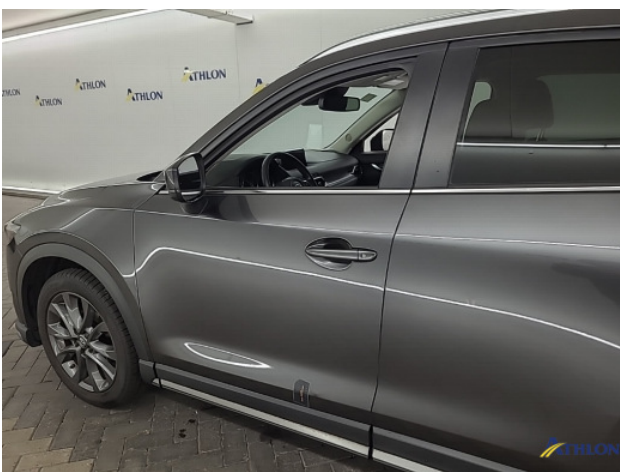
1. Portier voor - links Deuk/deuken