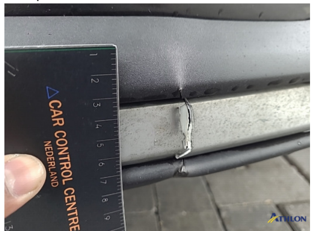
3. Voorspoiler Breuk / barst / scheur