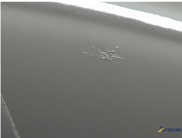
4. lakaantasting Beschadigd