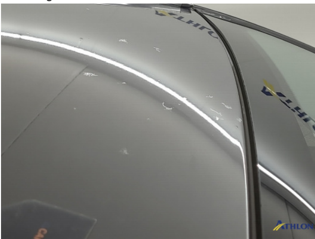
4. lakaantasting Beschadigd