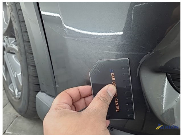
2. Voorbumper Schaafplek