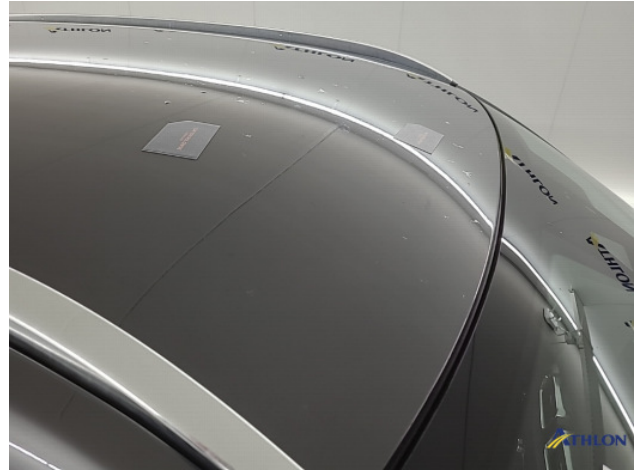
4. lakaantasting Beschadigd