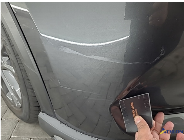
2. Voorbumper Schaafplek