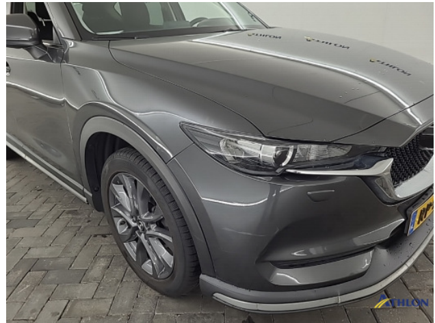
2. Voorbumper Schaafplek