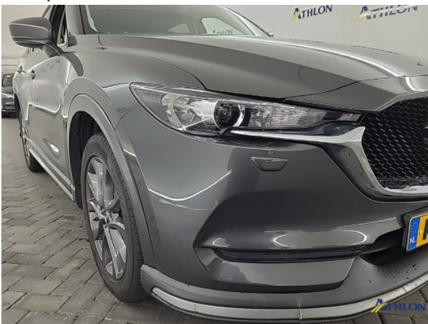
3. Voorspoiler Breuk / barst / scheur