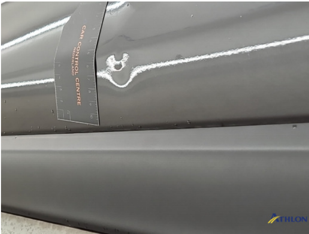
1. Portier voor - links Deuk/deuken