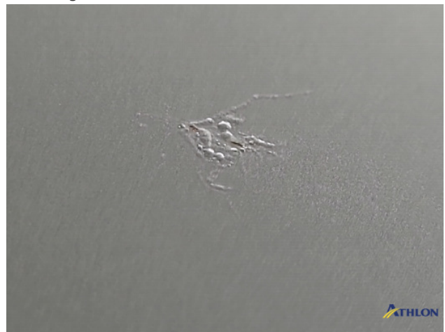
4. lakaantasting Beschadigd