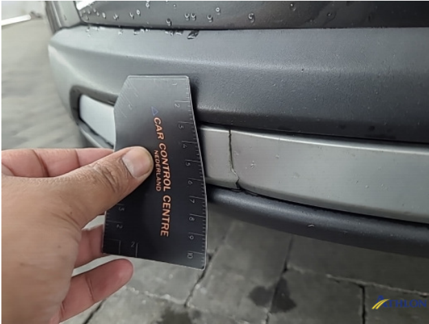
3. Voorspoiler Breuk / barst / scheur