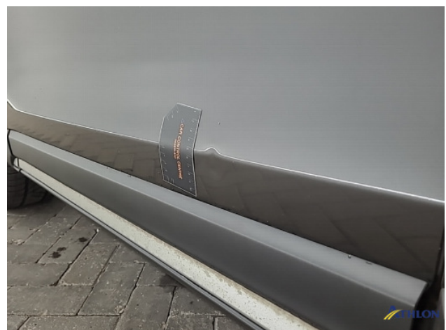
1. Portier voor - links Deuk/deuken