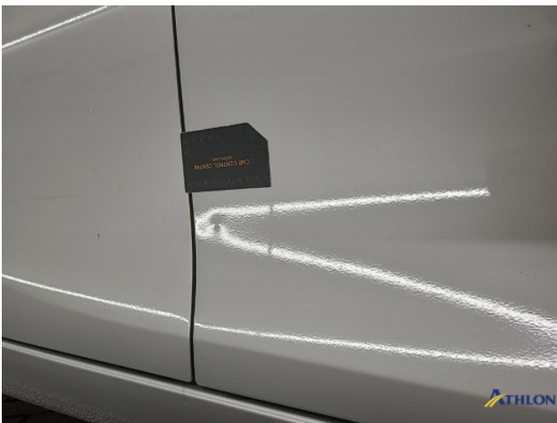
1. Portier voor - rechts Gebruikssporen