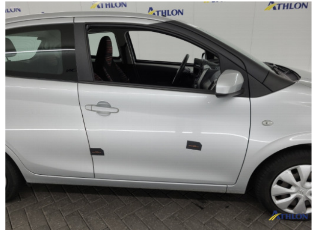
1. Portier voor - rechts Gebruikssporen