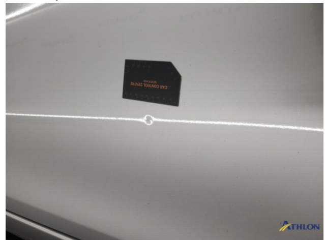
1. Portier voor - rechts Gebruikssporen