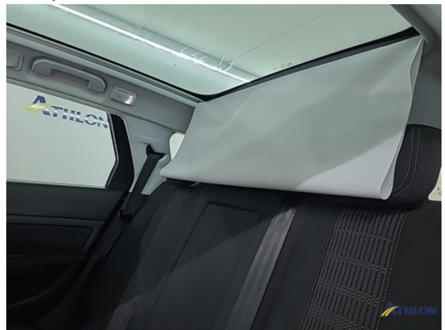
6. Panoramadak doek sluit niet goed af Gebruikssporen