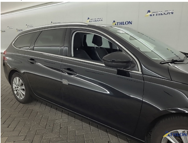
4. Portier voor - rechts Schaafplek