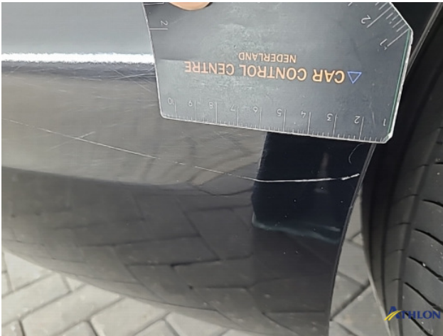
3. Achterbumper Schaafplek