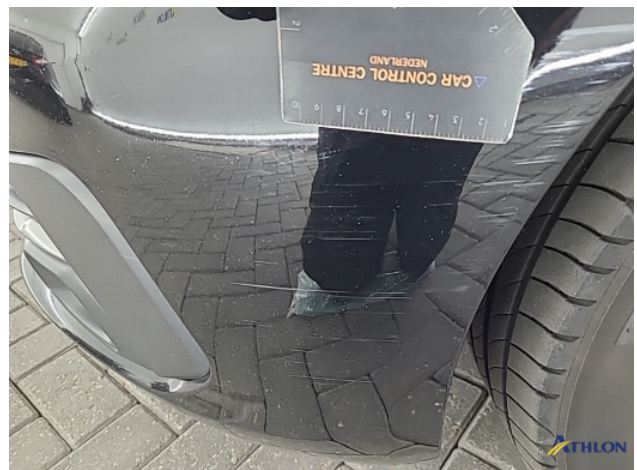
1. Voorbumper Schaafplek