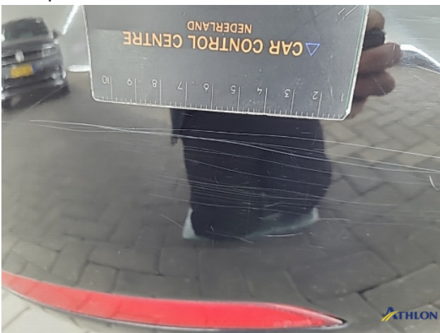
3. Achterbumper Schaafplek