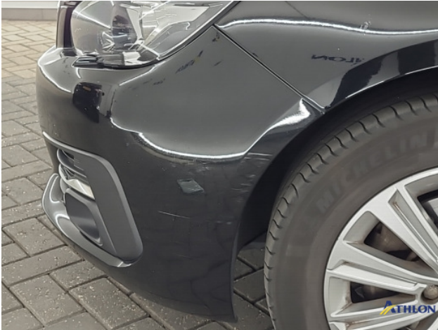
1. Voorbumper Schaafplek