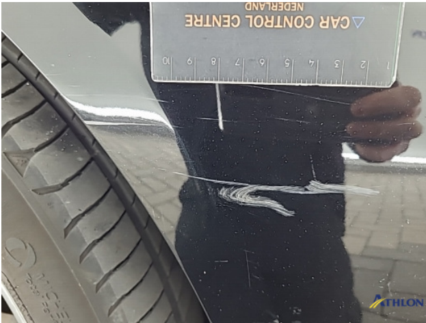
5. Voorbumper Schaafplek