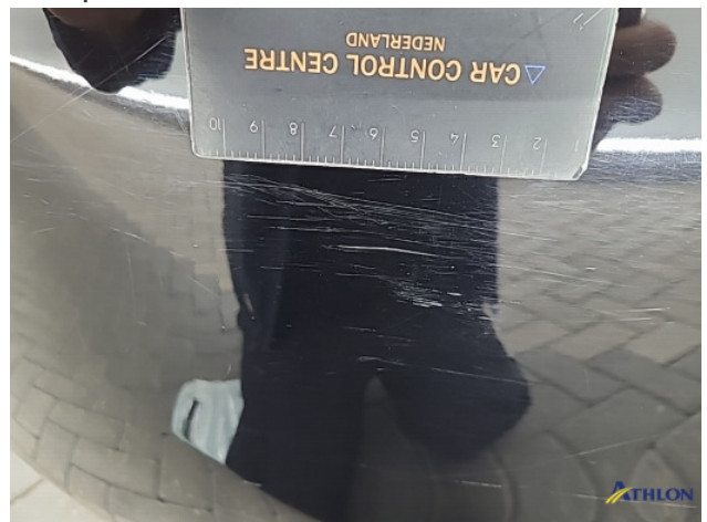
3. Achterbumper Schaafplek