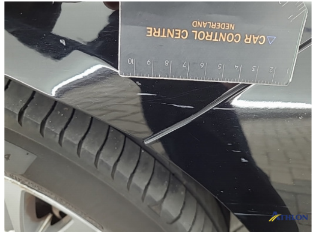
5. Voorbumper Schaafplek