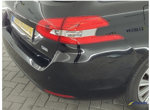
3. Achterbumper Schaafplek