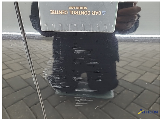
4. Portier voor - rechts Schaafplek