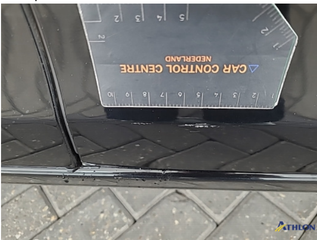
4. Portier voor - rechts Schaafplek