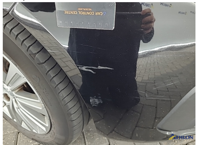
5. Voorbumper Schaafplek