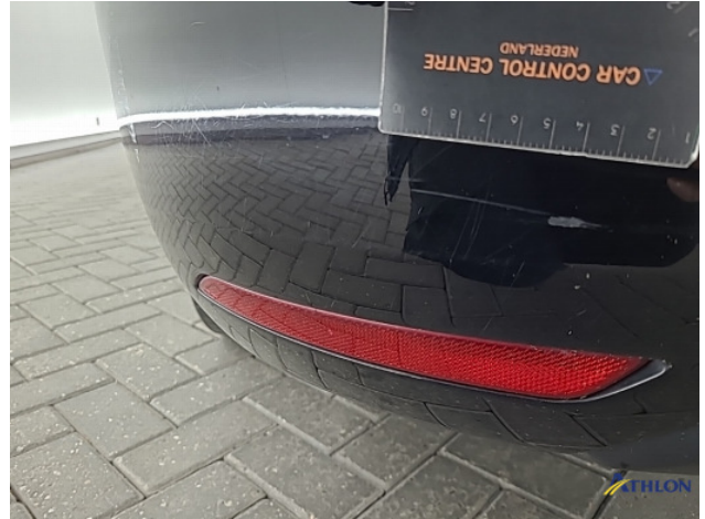
1. Voorbumper Schaafplek