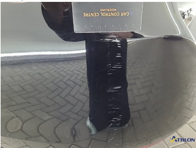
2. Achterbumper Schaafplek