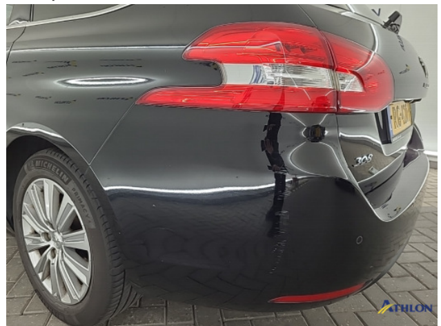
2. Achterbumper Schaafplek