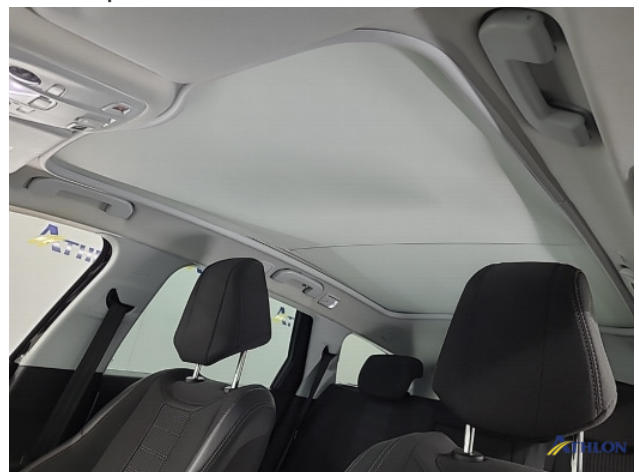
6. Panoramadak doek sluit niet goed af Gebruikssporen