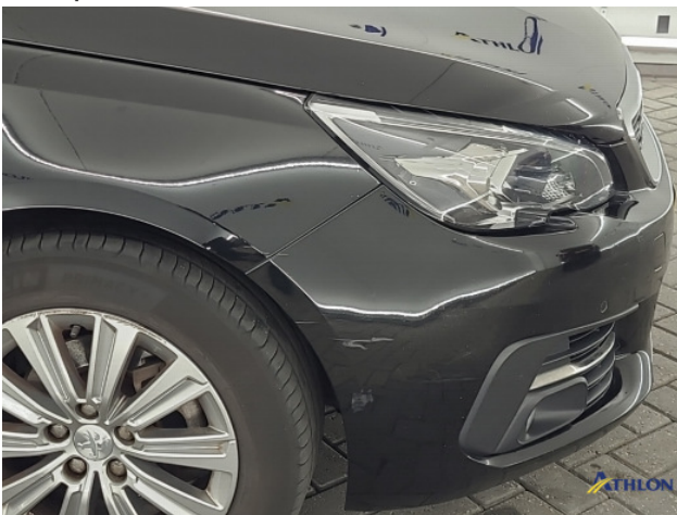
5. Voorbumper Schaafplek