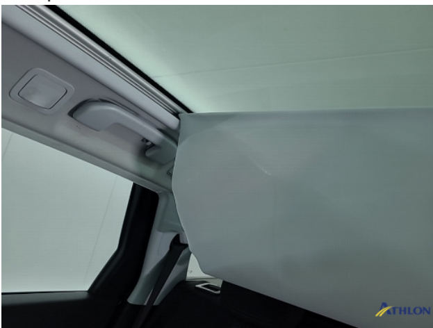
6. Panoramadak doek sluit niet goed af Gebruikssporen