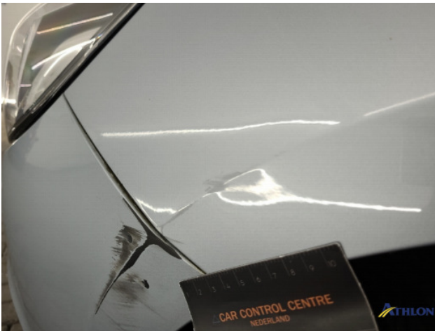
1. Voorscherm - links Gedeukt