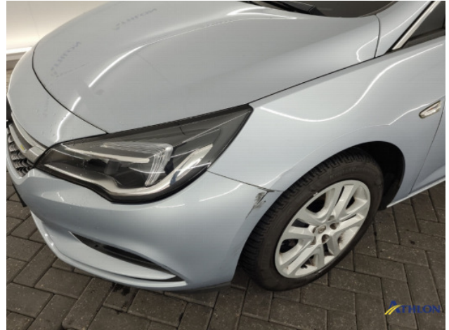
1. Voorscherm - links Gedeukt