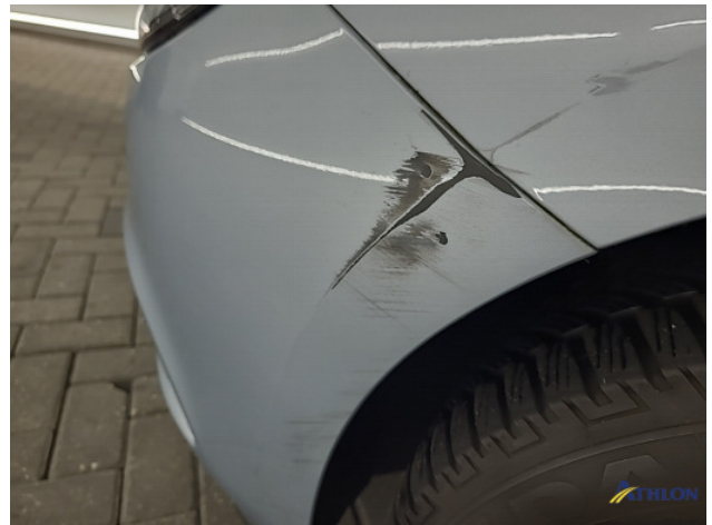
1. Voorscherm - links Gedeukt