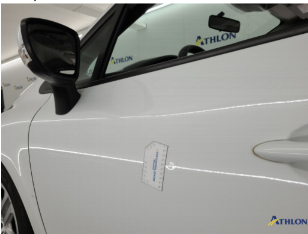
2. diverse Gebruikssporen