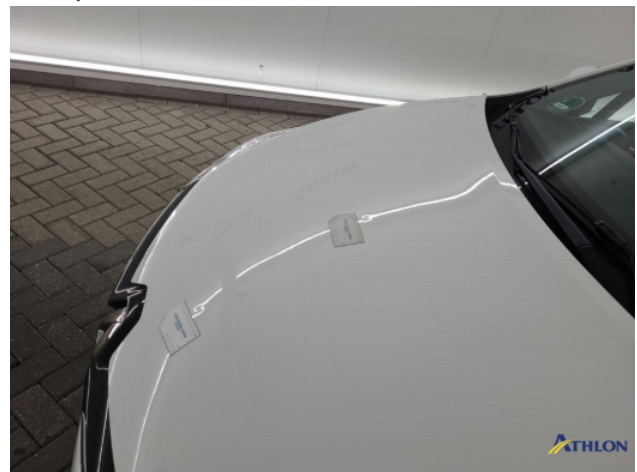
2. diverse Gebruikssporen