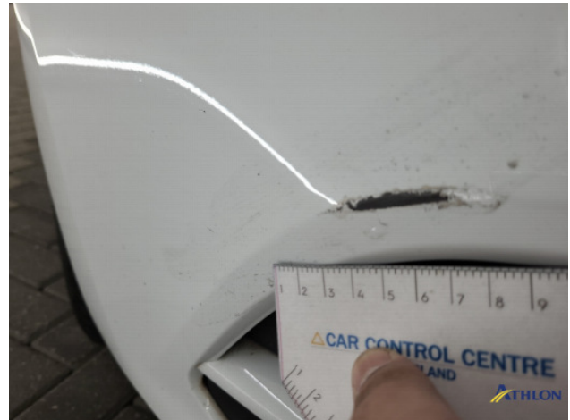
1. Voorbumper Schaafplek