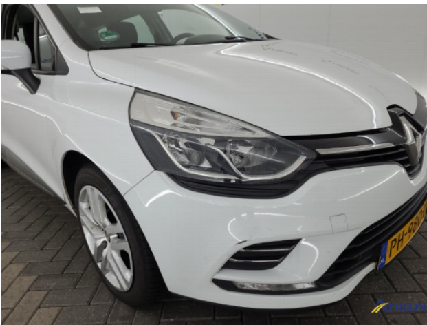
1. Voorbumper Schaafplek