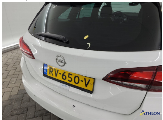
1. ontstickerschade Beschadigd