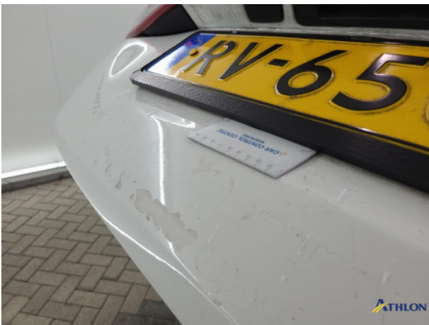
1. ontstickerschade Beschadigd