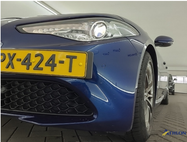
1. Voorbumper Schaafplek