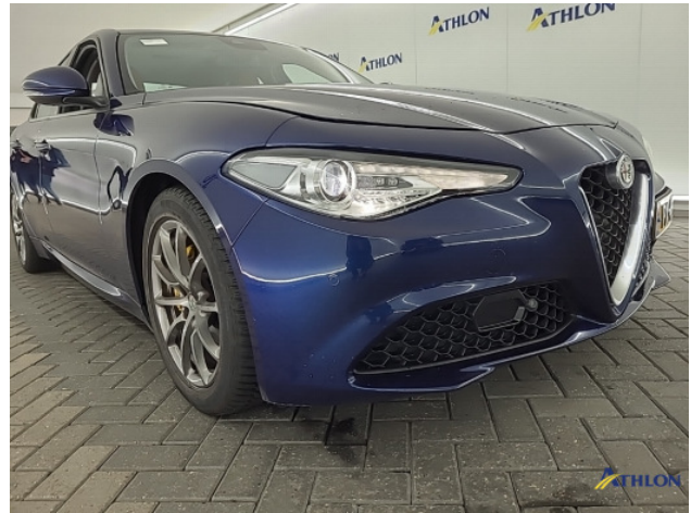
2. Voorbumper Schaafplek