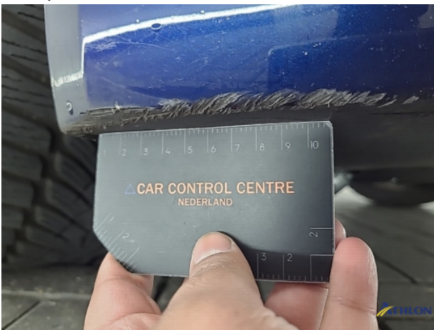
2. Voorbumper Schaafplek