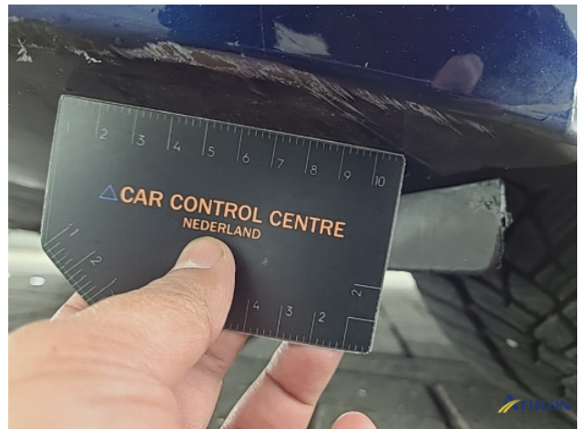
1. Voorbumper Schaafplek