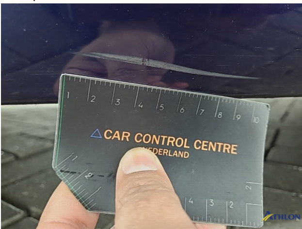
3. diverse Gebruikssporen