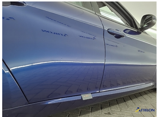
3. diverse Gebruikssporen