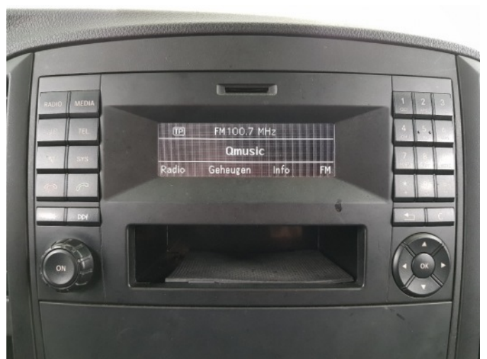
Navigatie of radio