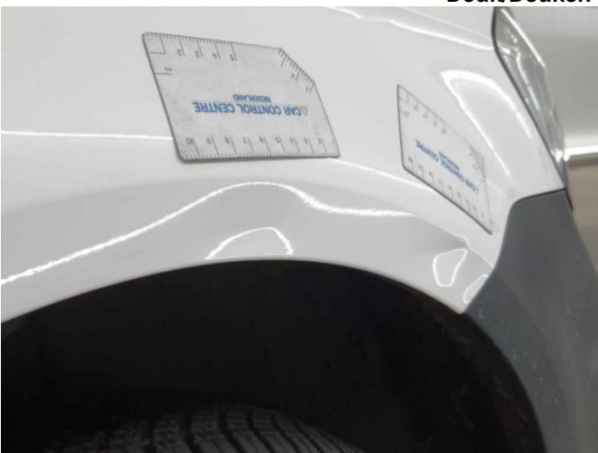
6. Spatbord voor- rechts