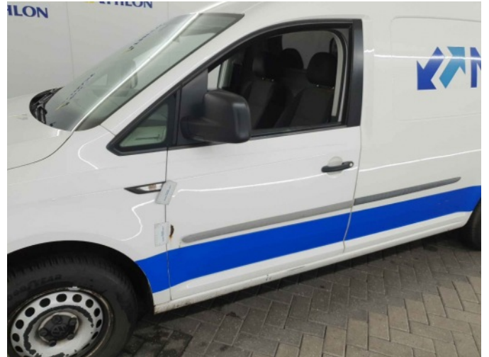
2. Portier voor - links