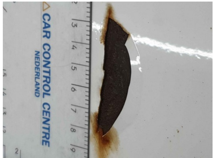
2. Portier voor - links