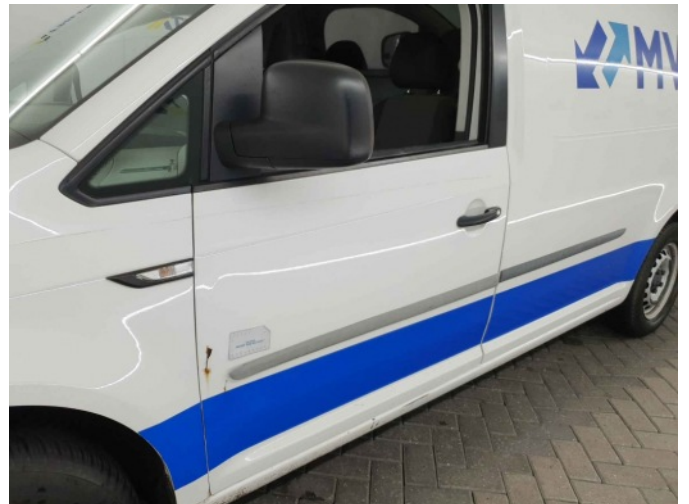
2. Portier voor - links