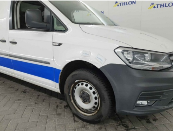
6. Spatbord voor- rechts