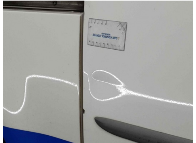
5. Portier achter - rechts