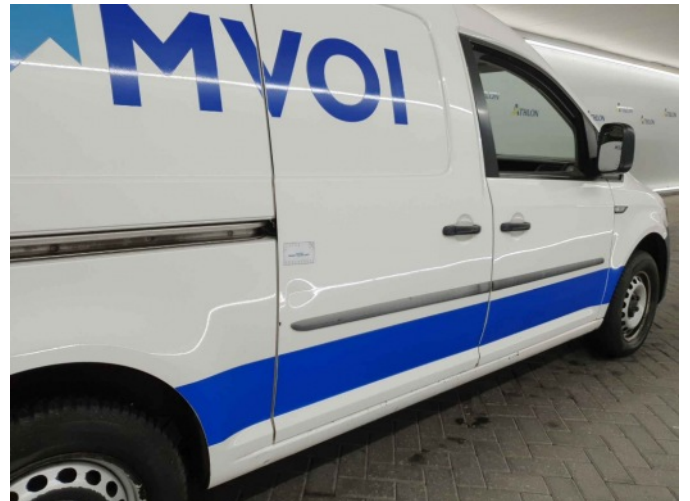
5. Portier achter - rechts