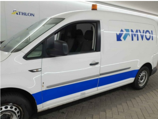
1. Dorpel - links