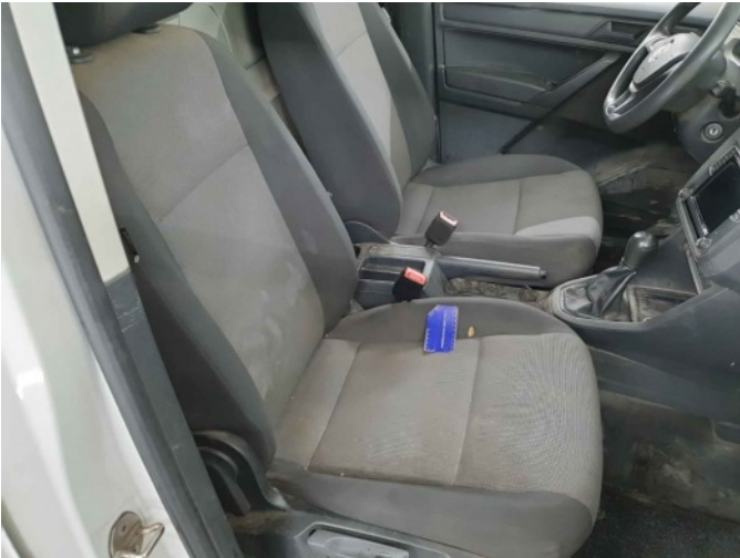
9. Stoel - voor - rechts: zitting