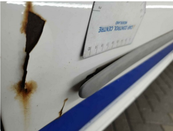
2. Portier voor - links