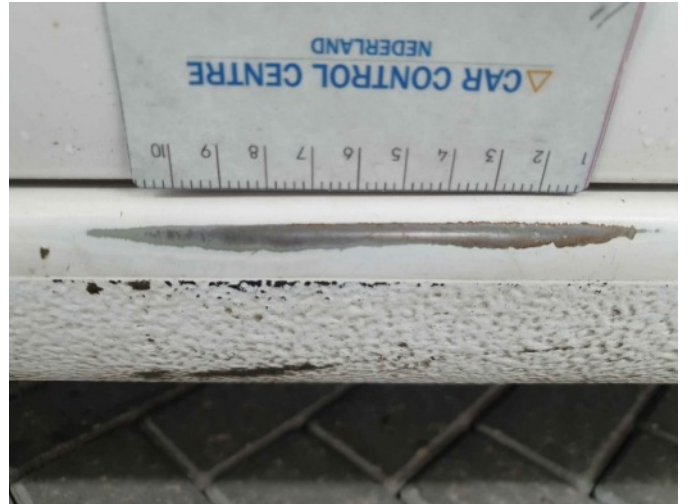
1. Dorpel - links