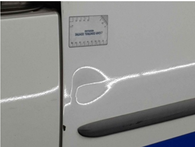
5. Portier achter - rechts