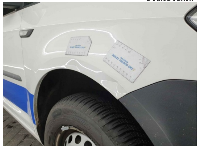
6. Spatbord voor- rechts