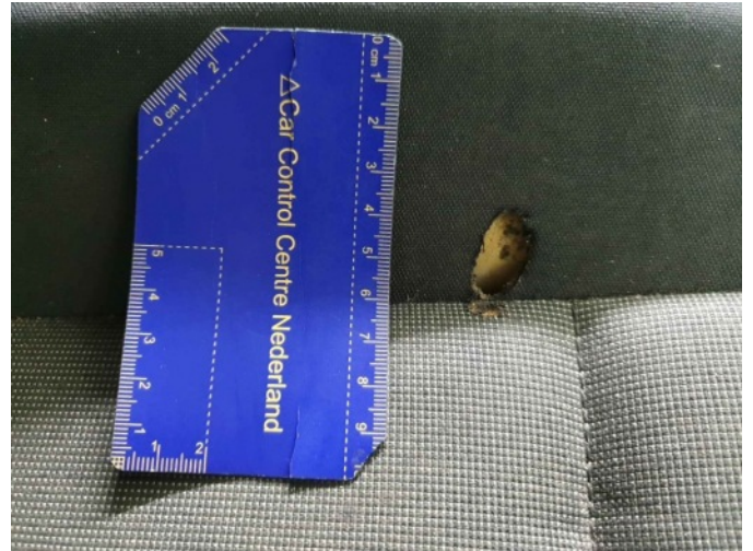
9. Stoel - voor - rechts: zitting