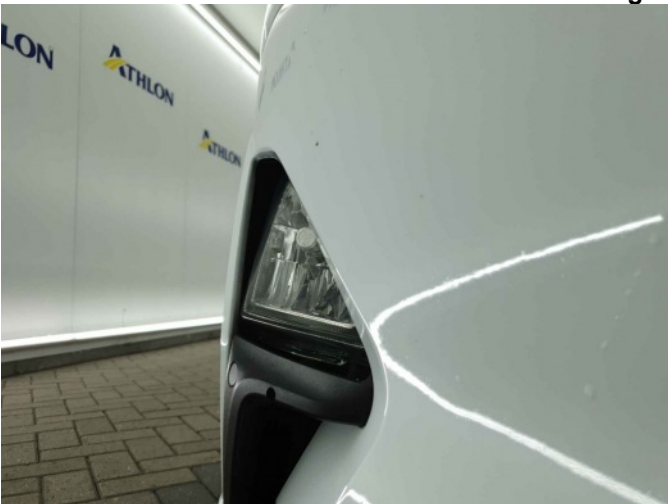
1. mistlicht voor rechts