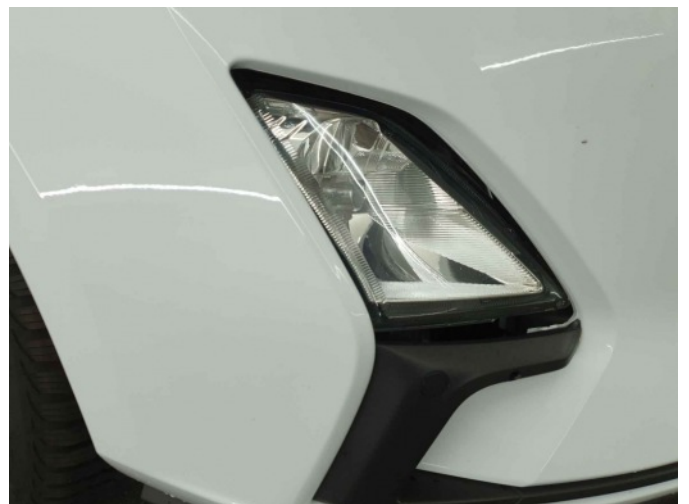
1. mistlicht voor rechts