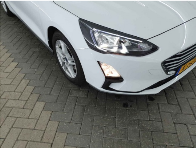
1. mistlicht voor rechts