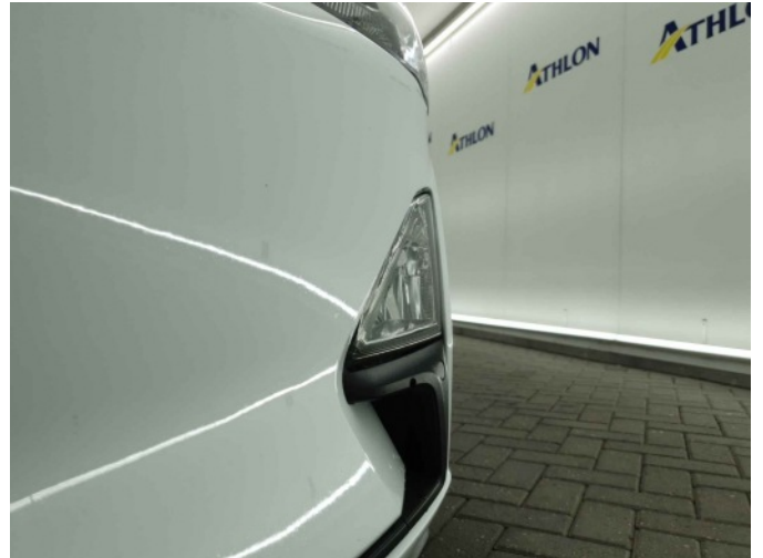
1. mistlicht voor rechts